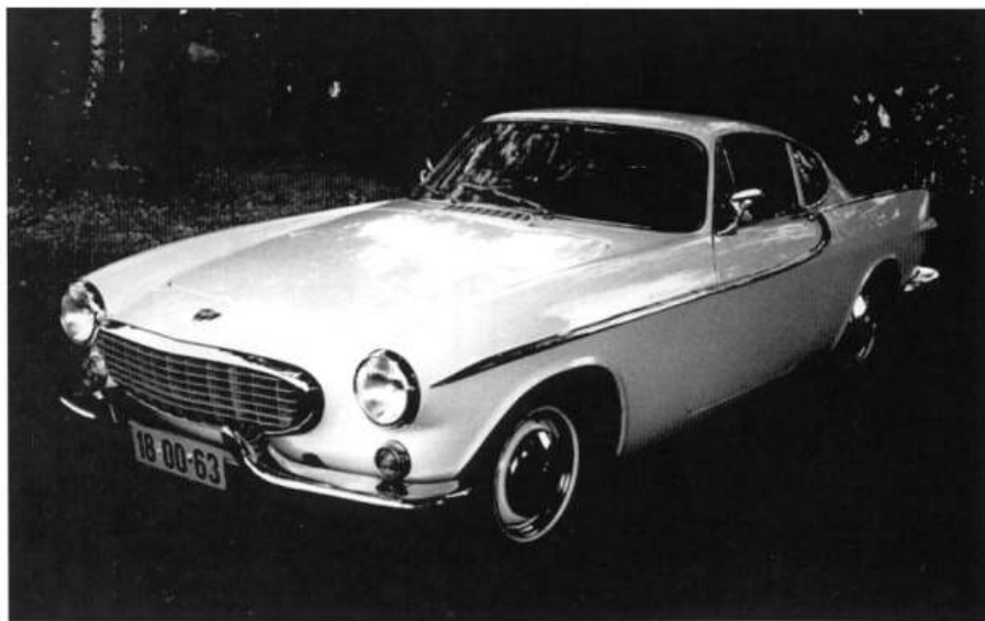
En snart innkjørt P 1800

Da jeg vokste opp på 60-tallet med Roger Moore som Helgenen, har jeg alltid likt Volvo P-1800. Bilen har også ett godt rykte når det gjelder driftsikkerhet, er enkel og grei å holde i orden, så når man ikke er spesielt dyktig eller tålmodig når det gjelder å skru startet søket etter en slik.