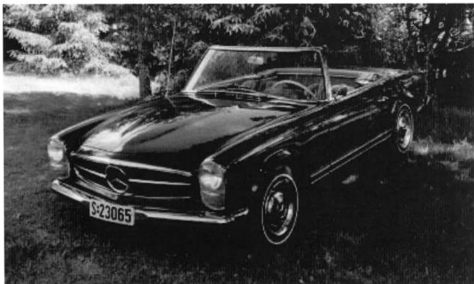
1965 MB 230 sl

18-00-63 feirer 40år's jubileum i år og har nå rullet 53000km, snart innkjørt.