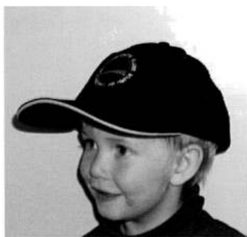
Cap med logo kr 150 farge sort og beige

I TILLEGG HAR VI FÅTT INN PINS MED LOGOEN VÅR PÅ.