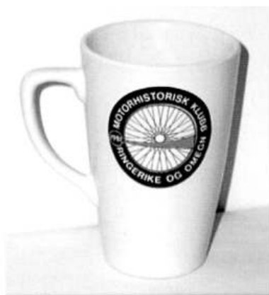
Krus Kr 100

Salg av effekter foregår på medlemsmøter eller ved henv til klubben mkro@lmk.no