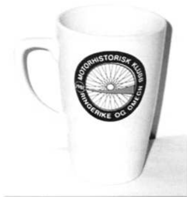
Krus Kr 100