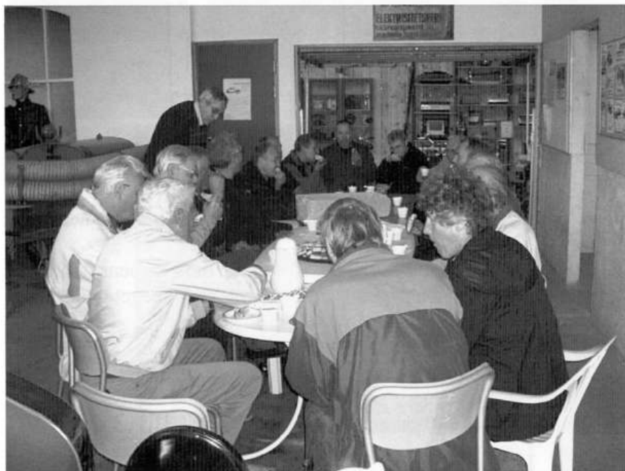
Et hyggelig besøk fra en av naboklubbene

På sommertid møtes medlemmene på onsdager nede ved elva i by sentrumet.