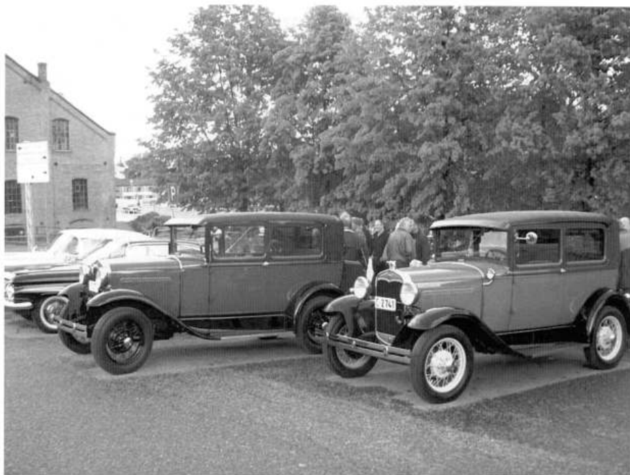
De besøkende kom i gamle kjøretøy.

Det er alltid hyggelig å få besøk av andre klubber med sammen lidenskap.