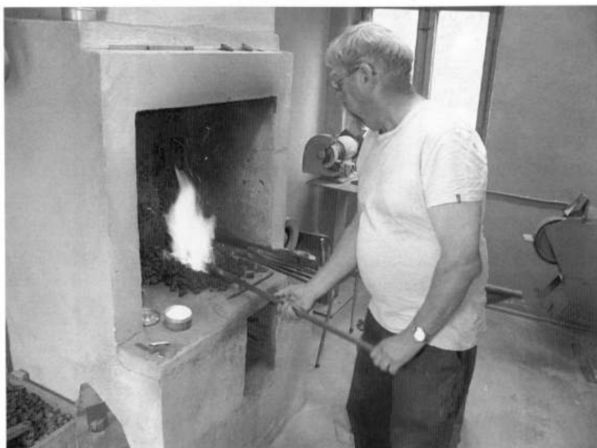
Smeden i full gang med å smi knivblader

På veiene av alle som var der vil jeg takke vertskapet for en hyggelig dag.