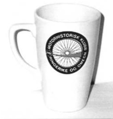
Krus Kr 100