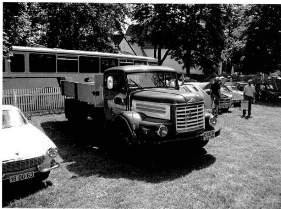
Steyer 586 fra 1964, Eier er Erling Råde.