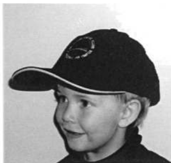
Cap med logo kr 150 farge sort og beige

Salg av effekter foregår på medlemsmøter eller ved henv til klubben mkro@lmk.no