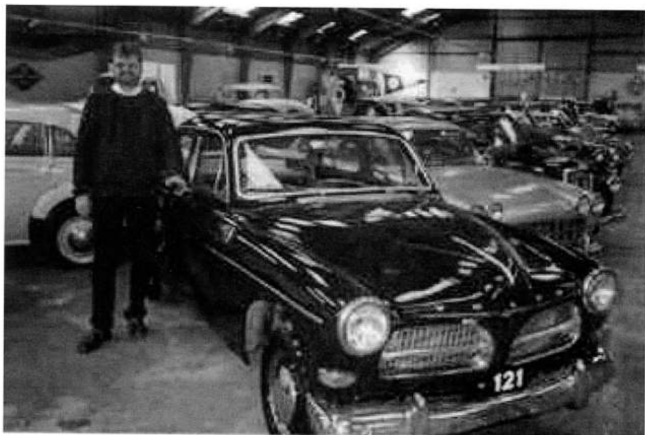
Dronningens første bil

To dage før sin 18 års fødselsdag fik tronfølger Margrethe sin første bil - en Volvo Amazon. Som civil nummerplade havde Volvos gave KA 20.121. Siden fik den kronepladen 121.