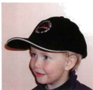
Cap med logo kr 150 farge sort og beige