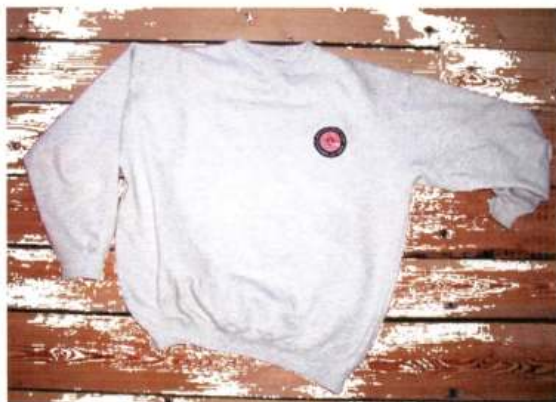
Collage genser Kr 180 Med klubblogo i farger