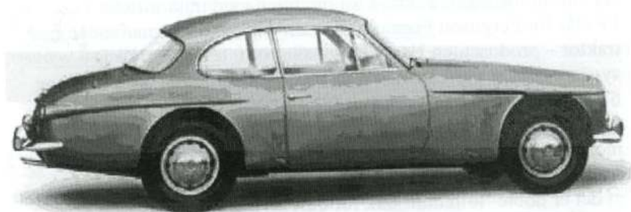
Jensen Prototyp fra 1965