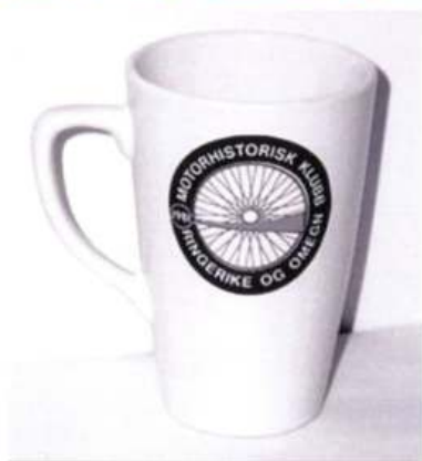
Krus Kr 100