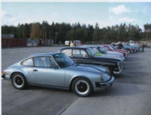
Et bra knippe med kjøretøy

Nok om dumme navn. Som sakt møttes folket til bilinspeksjon, for de som ønsket dette, og det var faktisk flere som ville ha en inspeksjon av doningen.