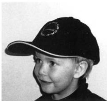
Cap med logo kr 150 farge sort og beige

Salg av effekter foregår på medlemsmøter eller ved henv til klubben mkro@lmk..no