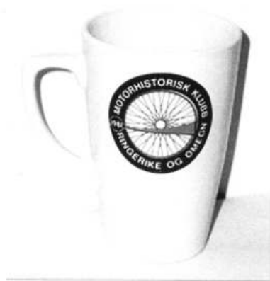
Krus Kr 100