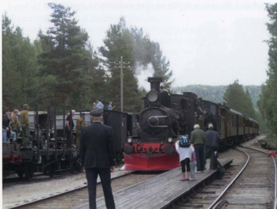
Stopp på Kløftefoss

Utenfor Vikersund jernbanestasjon var det linet opp grønt materiell i fleng. Grønt materiell er vel den rette terminologien for militære kjøretøyer. Disse kjøretøyene hadde også tenkt seg til Krøderen, da de hadde treff inne på stasjonsområdet.