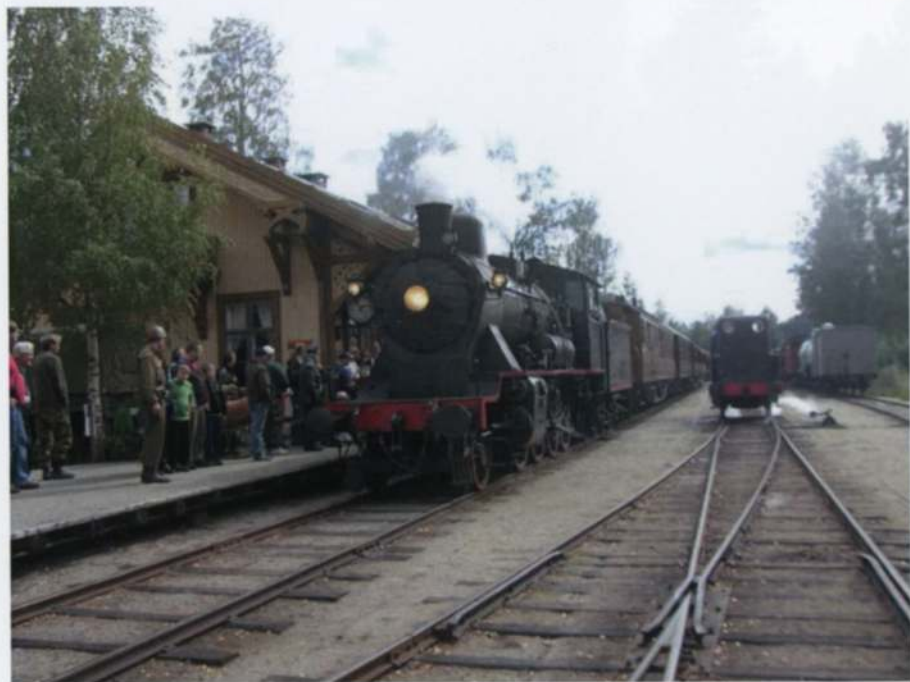
Her ankommer toget Krøderen stasjon

Vi snakket om yrende liv på stasjonen før slikkmunnen tok overhånd. Stasjonen hadde en eller muligens to som ordnet