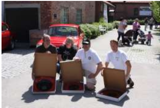
Representanter fra klubbene mottok gaver fra Hadeland glassverk