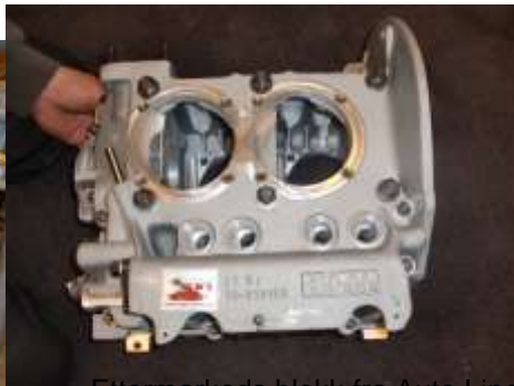
Ettenmarkeds blokk fra Auto Linea for 2,3 l. med blant annet forsterket gjenger til sylinderpinner.