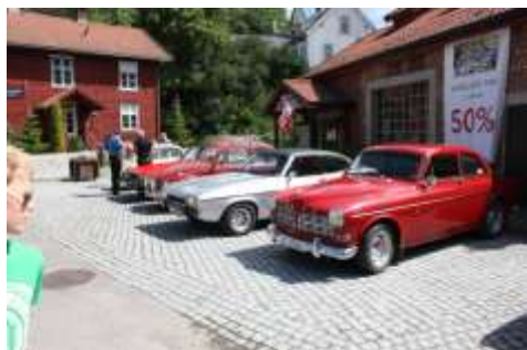
En fin dag for en hyggelig sammenkomst