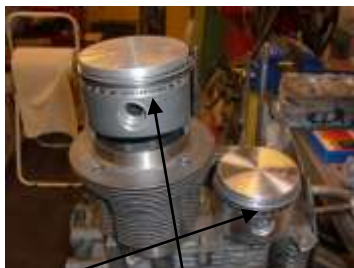
Originalt og racing stempel for modifisert 1915