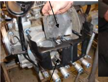
Kjøleblikk for racing type 3