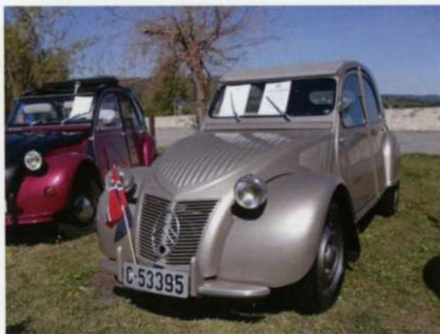
Citroen 2 CV 1953

A/S BILUTSTYR DELER • REKVISITA • VERKTØY