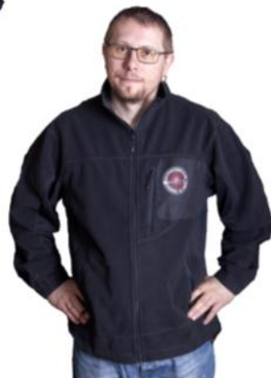
Jakke på forespørsel