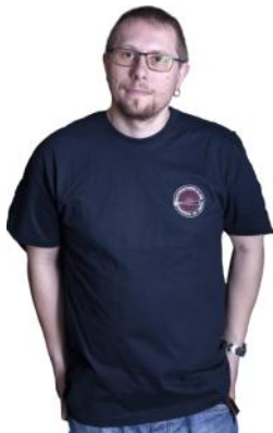
T-skjorte 125,- T-skjorte grå, gammel type 75,-