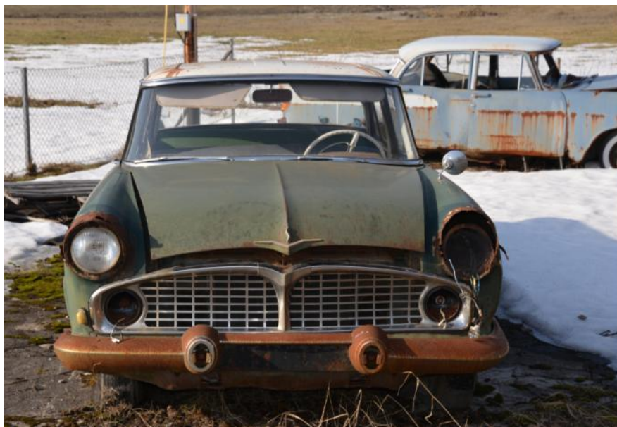
Ford Zephyr fra Vestfold

Motorhistorisk klubb Ringerike og omegn Postboks 1019 3503 Hønefoss