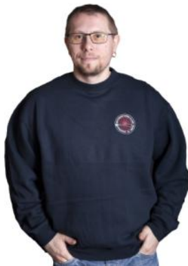
Genser 250,- Mørk blå eller grå