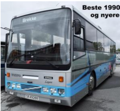
Beste 1990 og nyere

1989 DAF MB 230 LT med Arna karosseri, eier Østerdalen billag AS