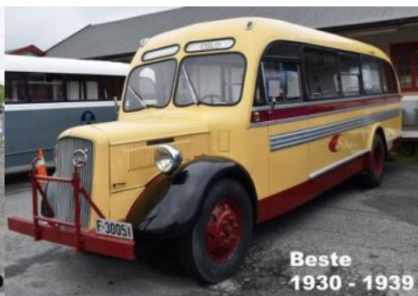
Volvo B11 1938 modell med Axelsen karosseri, eier Nettbuss