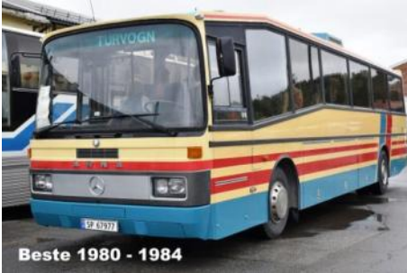
Beste 1980 - 1984