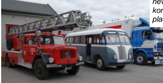
De store er på plass til åpningen..