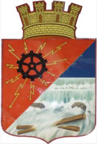
Hønefoss sitt gamle kommunevåpen har overlevd alle kommunereformer og er på plass i utstillingslokalet