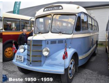
Beste 1950 - 1959

1947 Chevrolet med Axelsen karosseri, eier RHF Rogaland