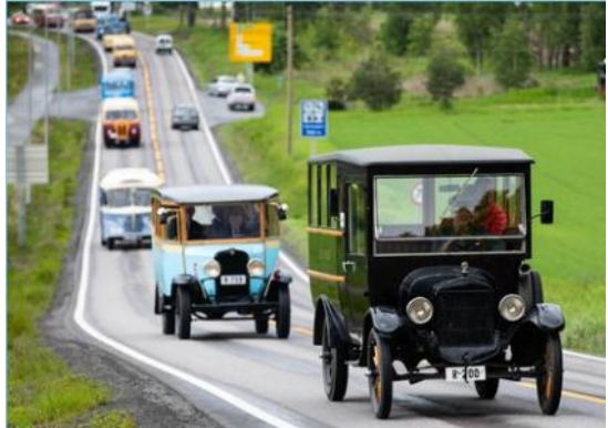
Lang rekke anført av 1920 T-ford.

medlemmer hjalp til så måtte vi leie inn noen ungdommer for å få nok personell, men takk til all flott innsats dere gjorde.