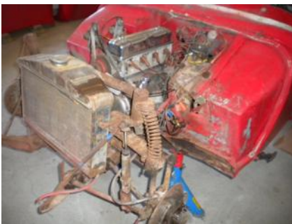
Overhaling 2012.

forgassere. Karosseriet ble støpt i glassfiber, så dette må være en av Norges aller første biler med glassfiberkarosseri. Resten av delene fikk de tak i forskjellige steder. Prosjektet vakte oppsikt, og ble bl.a. omtalt i Ringerikes blad.