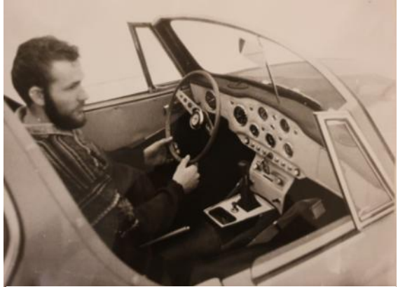
Stolt bileier i 1969