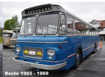
Beste 1965 - 1969

1961 Scania Vabis D10 med Repstad Karosseri, eier RHF Lillehammer og Gudbrandsdal