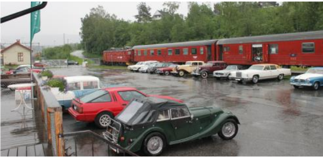
Motorkonvoien på Senteret .

Motorkonvoien 2019 ble avviklet fra søndag 2. juni ( Tromsø ) til fredag 7. juni. Den ble arrangert i samarbeid mellom LMK og AM-CAR. Konvoien var oppdelt i 5 forskjellige ruter fra hele landet med start i Stavanger, Kristiansand, Tromsø, Halden og Bergen.