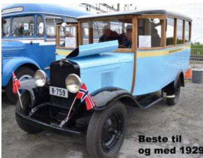
Chevrolet 1929 med Hartveit karosseri, eier Prosjekt CH29 (Veteranbusklubbb BNR)