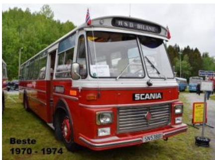
Beste 1970 - 1974

1967 Volvo B57-60 med Ama karosseri, eier RHF Glåmdal