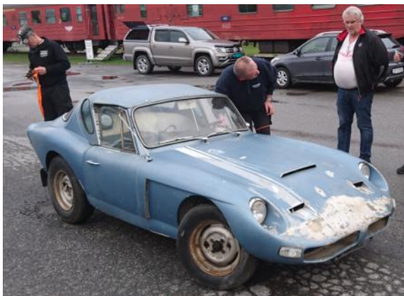
P.T bilen i 2019