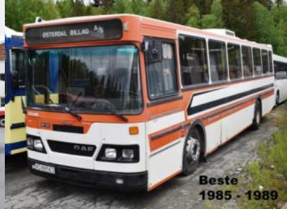
Beste 1985 - 1989