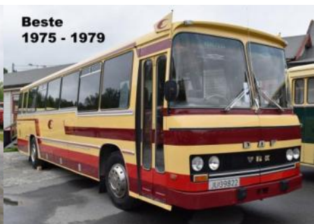
Beste 1975 - 1979

1974 Scania D11 R21 med Repstad karosseri, eier Tide buss, Kvinnherad