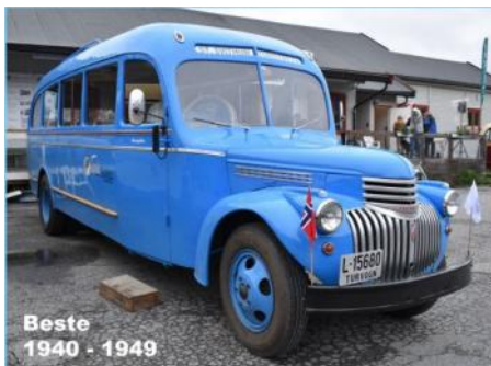
Beste 1940 - 1949

1947 Chevrolet med Axelsen karosseri, eier RHF Rogaland