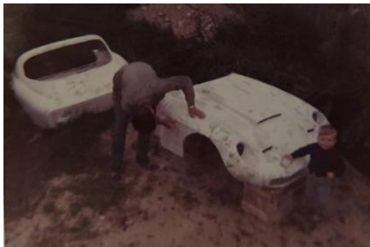
Sparkling og sliping av karosseriet.

– Forstillinga og fremre del av ramma er fra Fiaten, bakre del av ramma laget jeg selv forteller Per.