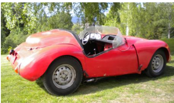
Etter overhaling i 2012.