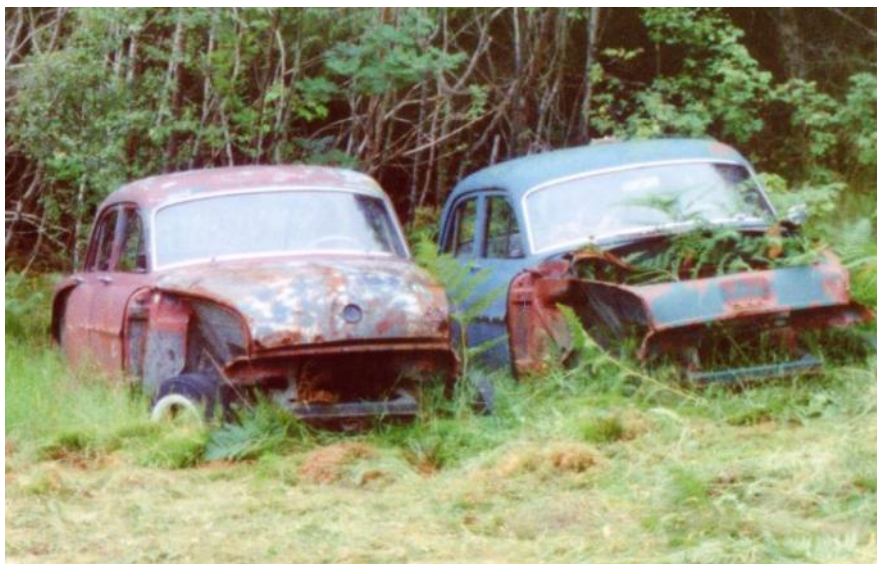
To Opel Kaptein 1954-56 på vei tilbake til naturen.

Motorhistorisk klubb Ringerike og omegn Postboks 1019 3503 Hønefoss