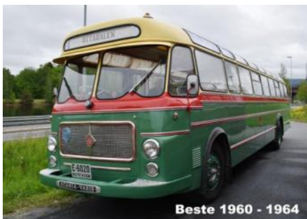
Beste 1960 - 1964

1950 Bedford OB med Rasmussen karosseri, eier Hordaland Veteranbuss Stiftelse avd. Tide Veteranbusser