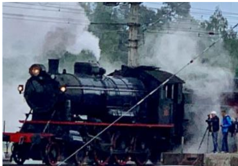
Alltid stas med veterantog!