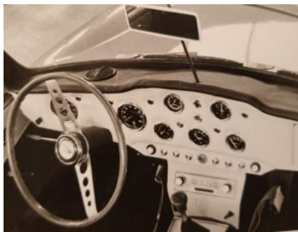
Bilen har et velutstyrt dashbord