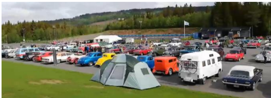
Treffplassen på Lillehammer.