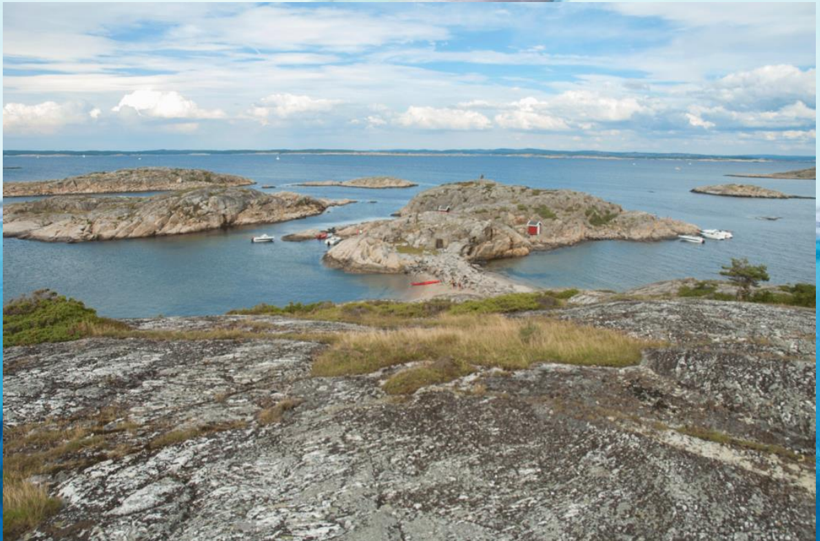
Fra Hvaler-skjærgården (Tisler)