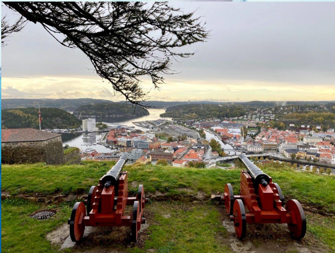
Halden sett fra Fredriksten festning.