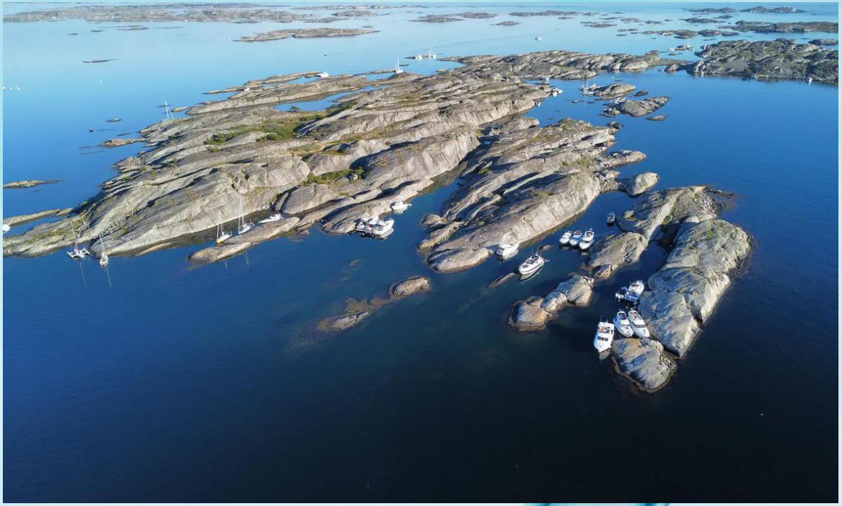
Fra Koster-skjærgården (Arholmen)