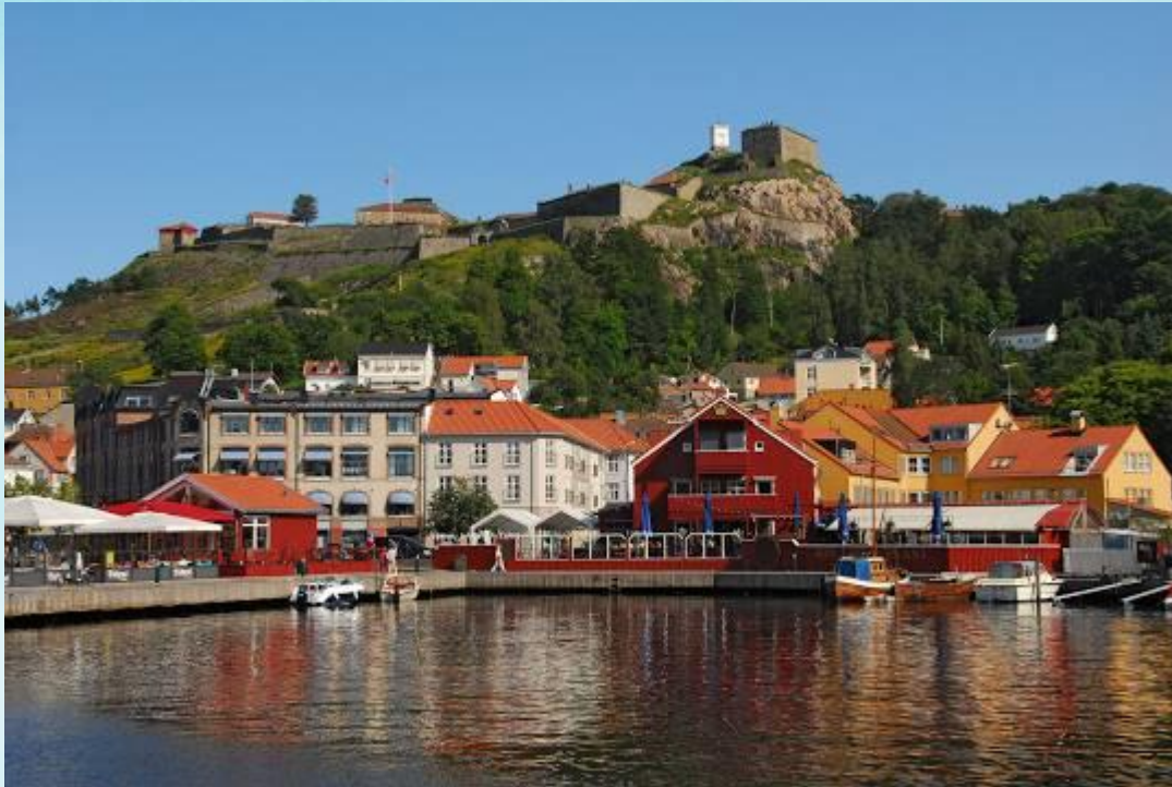
Fredriksten festning og Halden gjestehavn