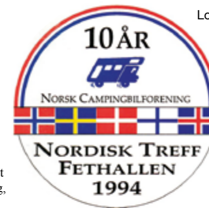
Logo Nordisk 1994.