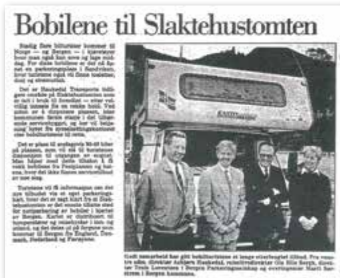
Slakterhustomten Bergen. Bergens Tidende.

På det samme årsmøtet ble det også bestemt at medlemmene selv skulle bestemme hvor årsmøtet i 1991 skulle avholdes. Forslagene var Geilo, Kinsarvik, Kongeparken og Ferkingstad. Etter at ca 1/3 av medlemmene hadde sendt inn stemmesedel, ble det Geilo.