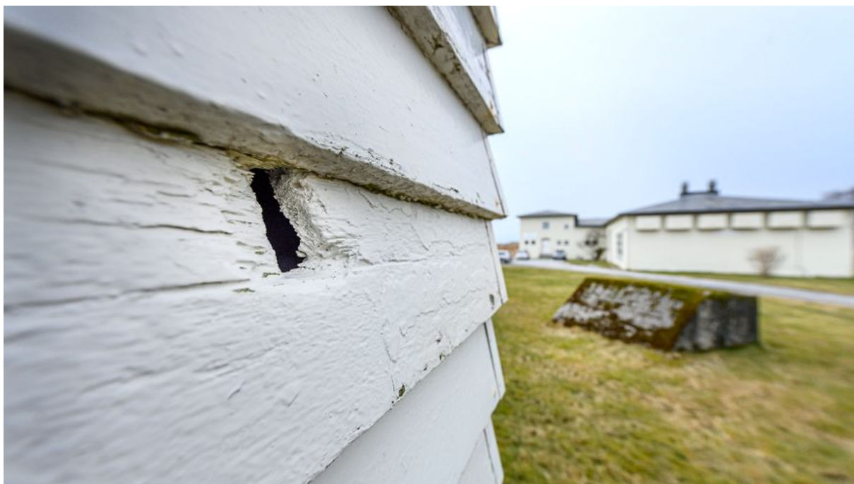
Vigra Kringkaster Hull etter en rikosjett etter bombingen og skytingene på en av bygningene til stasjonen på Synes på Vigra

Enkelte av installasjonane har framleis kulehol og spor etter splintar, frå tyske og seinare britiske flyåtak under Andre verdskrig.