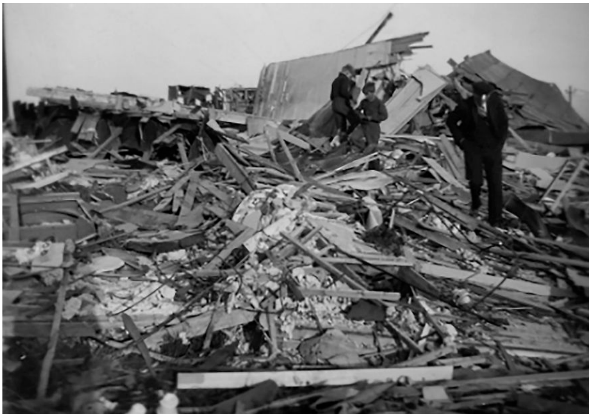
Bomba: Vigra kringkastar vart bomba av tyske fly den 15. april 1940.

I 9-tida på morgonen kjem dei første flya. Ut over dagen kjem det stadig nye bølger av angrep.