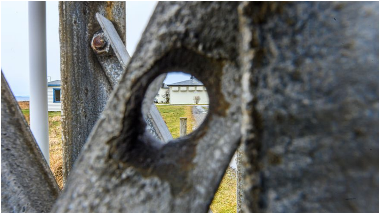
Kulehol: Kulehol etter bombing og maskingevær-skyting på ein av lysstolpane på stasjonen på Synes på Vigra.