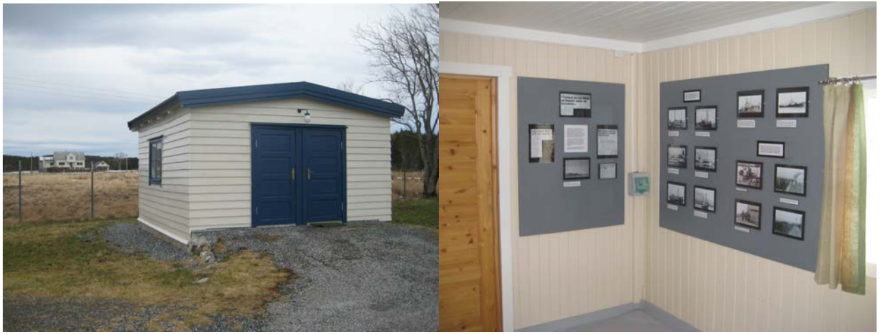
Lager35/Tyskarbrakke40 - opning 2008-03-31 Lokal krigshistorie frå Vigra Kringkastar og Vigra