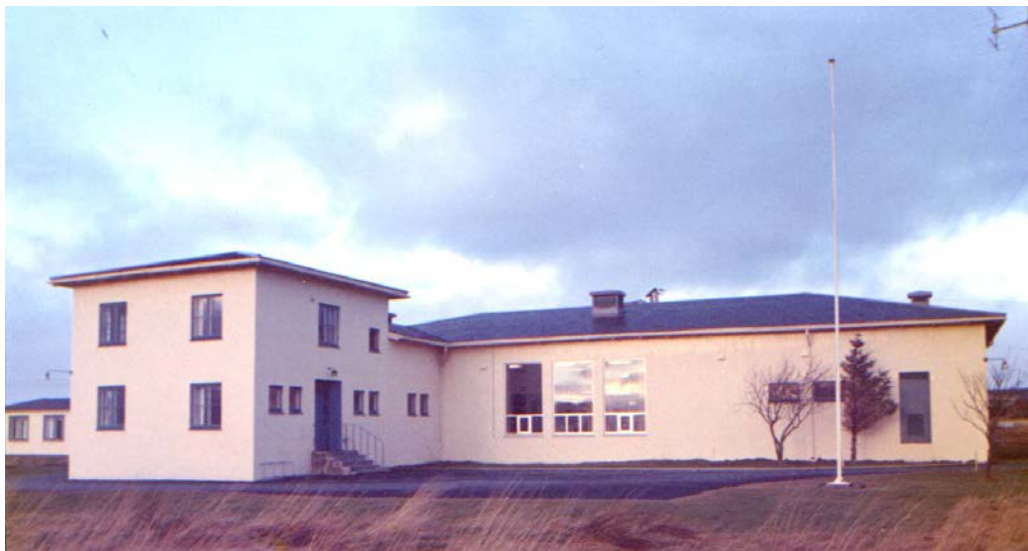
Nytt sendaranlegg 1948 Nytt sendarbygg – foreslått vernet av Telenor og riksantikvaren 1996 Mekanisk verkstad – nesten urørt frå 1948.