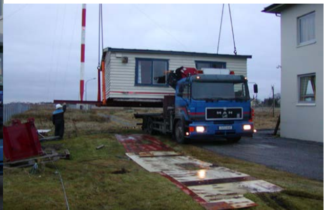
Flytting av krigssendar-bygget hausten 2001