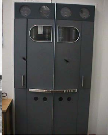
Krigssendar med originale kulehol etter flyangrep i krigen.