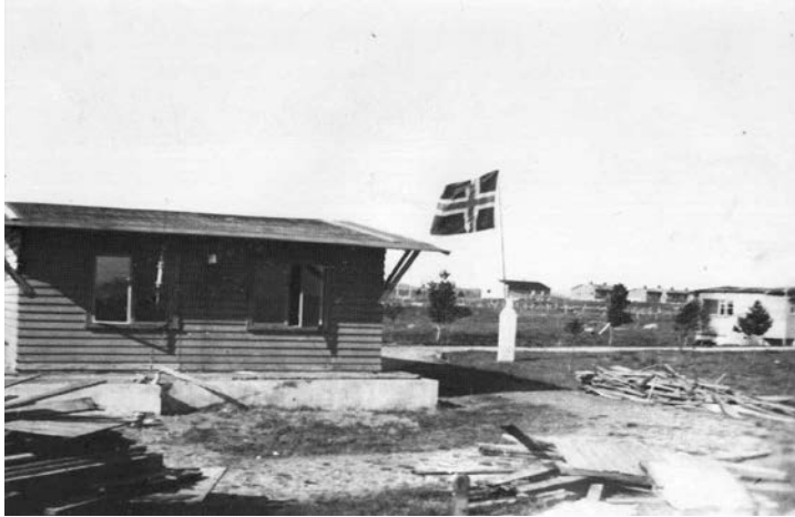
Krigssendarbygg 17. mai 1945

40 - Western Electric 1 kW - original sender m/kulehol og sendarbygg står på Vigra