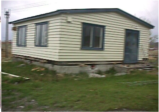
Planlegg flytting krigs-bygget – hausten 1998