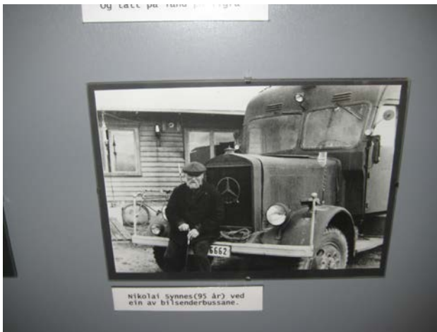
1945 - 48 20 kW mobil sender i drift - krigsbytte frå Finland