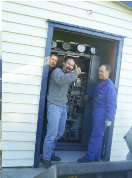
Museumsområde etablert 1998-2008 med økonomisk støtte frå Norkring A/S og Norsk Telemuseum