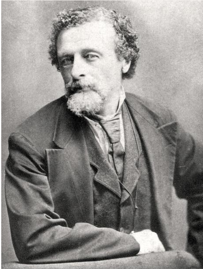
Portrett av Marcus Thrane til visittkort, Chicago ca. 1875.

Foto: Store norske leksikon. Thrane utvandret til USA i 1863, hvor han ble en kjent journalist.