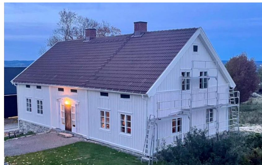
Aas gård, Gjøvik