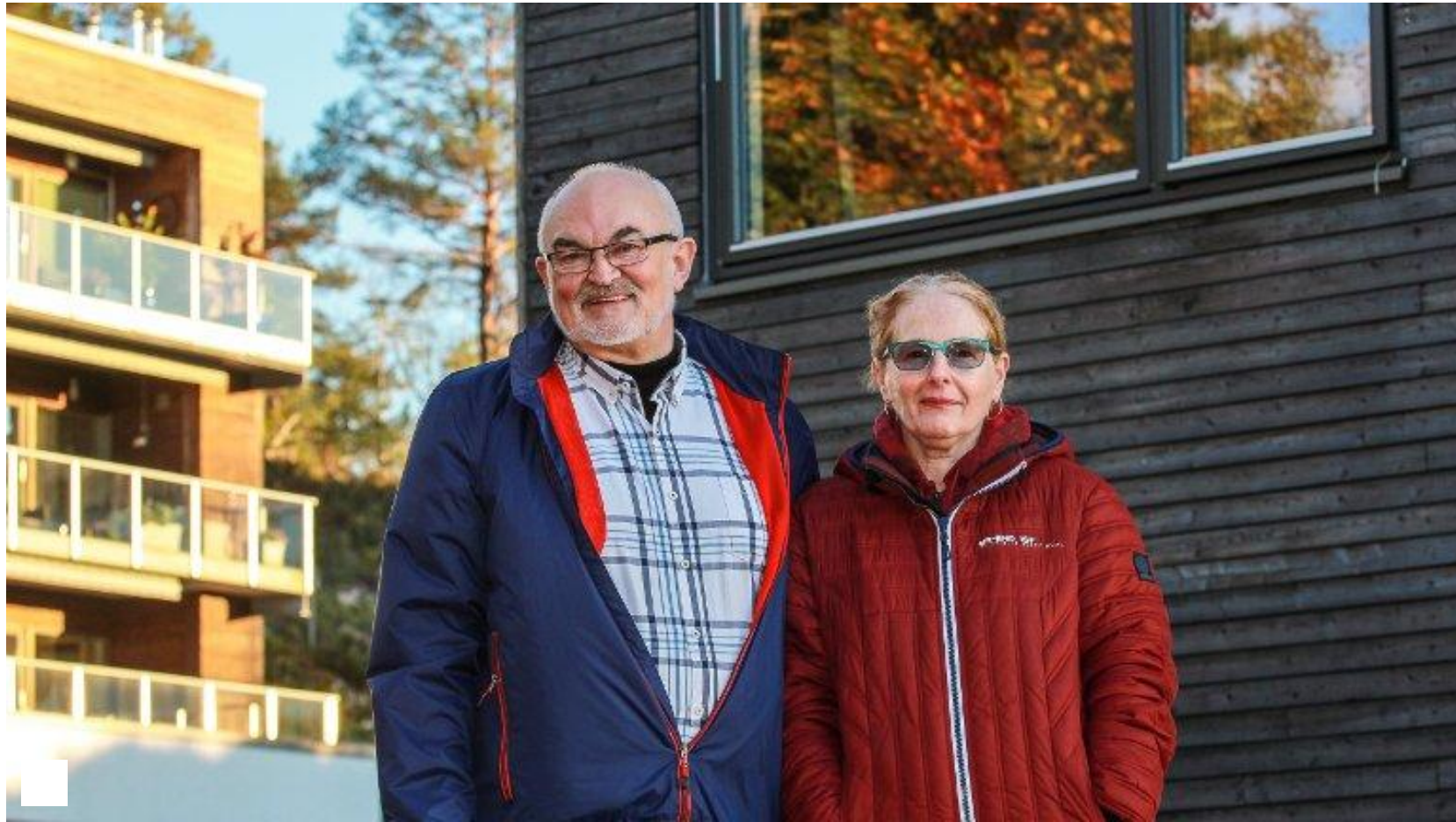
Samboerpar reagerer: Fikk felt furuer rett utenfor soveromsvinduet