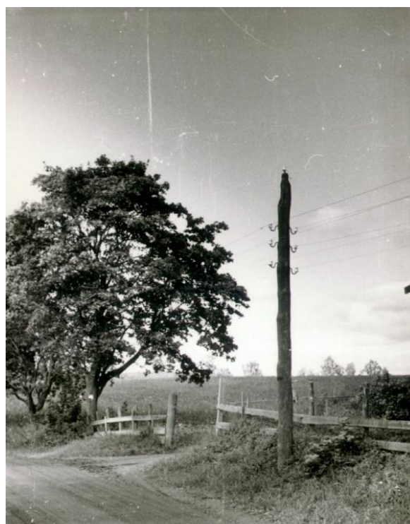
Eksempel på en ganske primitiv stolpekurs langs landeveien. De første telefonlinjene ble bygget med bare en jerntråd til hver abonnent. Da kvaliteten ved bruk av enkeltlinje var dårlig ble disse senere ombygd til to tråder av bronse.