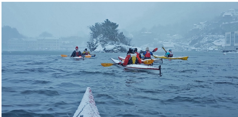
Tirsdagspadling i mars.

Det har vært gjennomført NPF introduksjonskurs, grunn- og teknikkurs gjennom hele sesongen, flest i vårsemesteret.