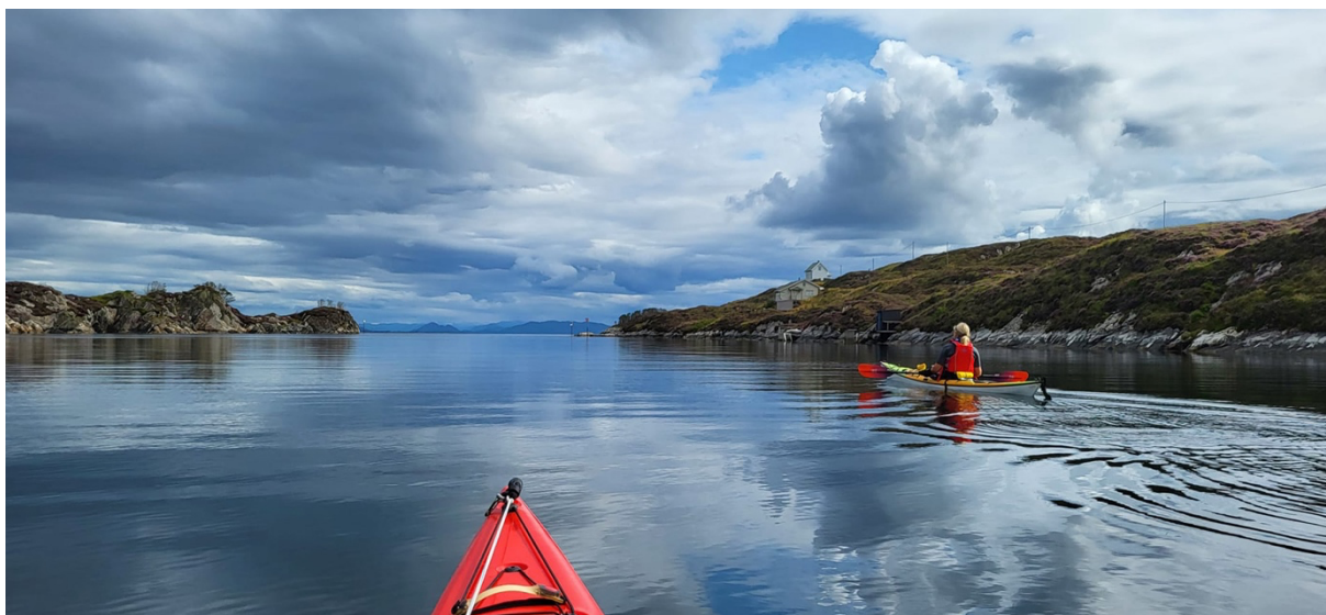
I Nordøysundet nordst i Øygarden.