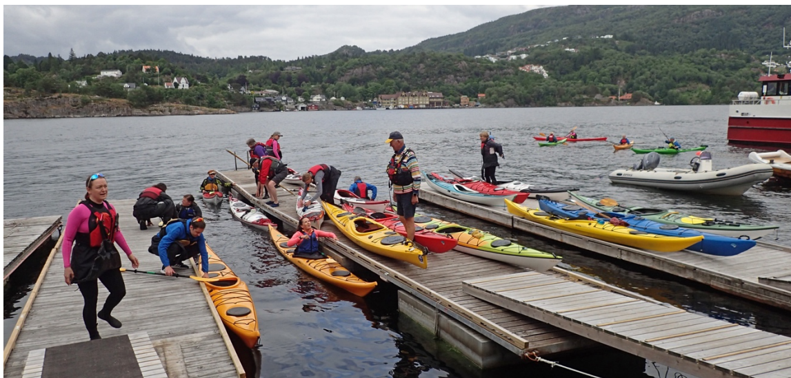
Høyaktivitet året rundt.