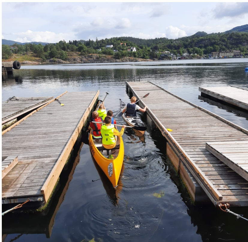
Første prøvetak i kano på sommerleir.

Tertnes idrettskole var i 2023 hos oss ved to anledninger. Én pulje (ca 20stk) på våttkortkurs (intro) og én pulje med ca 30 barn som var nede på en 3 timers aktivitetsskveld. Dette arbeidet er noe vi ser positivt på, og har også for 2024 planlagt denne type aktivitet.