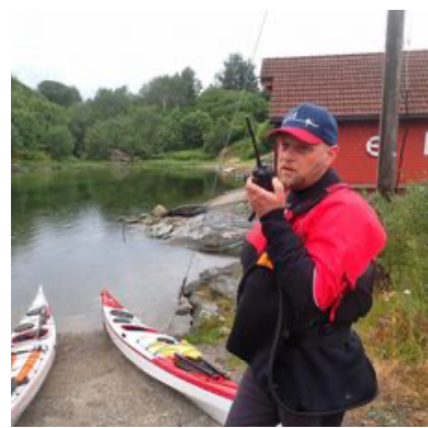
Trening i bruk av VHF.