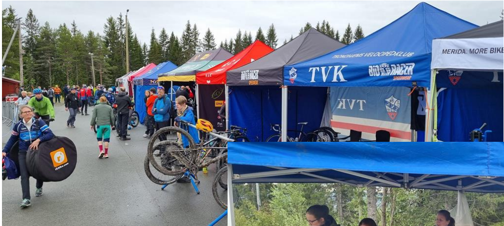
Noen bilder fra NM Nilsbyen, 2023