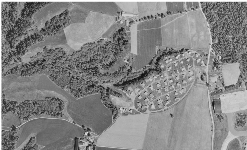
Flyfoto av Kneppfeltet i 1970