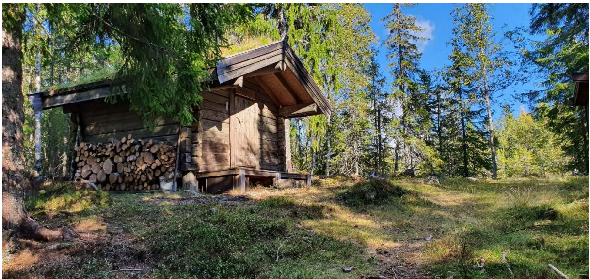
Hytte på Gardlimåsan slipplass