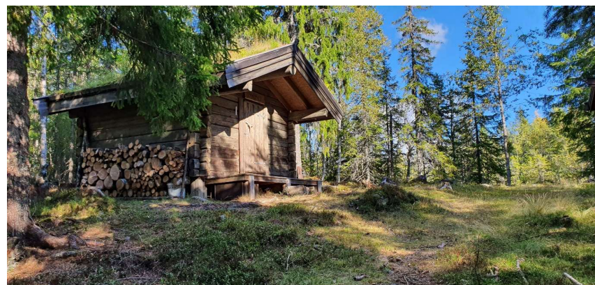
Hytte på Gardlimåsan slipplass