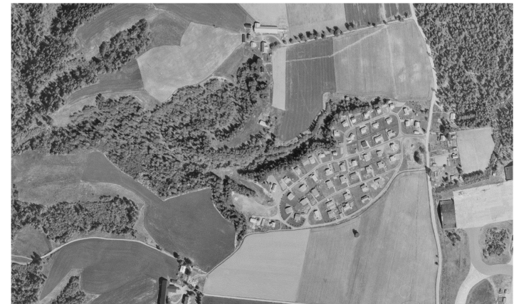
Flyfoto av Kneppfeltet i 1970