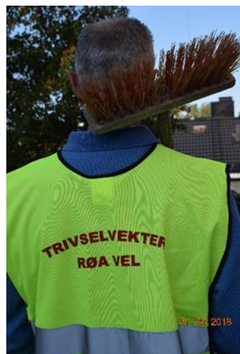
Mange synes det er greit å iføre seg en Røa trivselsvest når man er i aksjon. Vi har vester til alle!

Vi håper du tar utfordringen! Meld deg på som trivselsveker. post@roa-vel.no