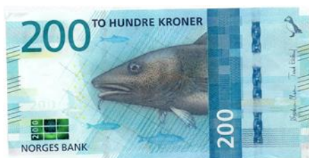
Medlemskap i Røa Vel koster kr 200 pr husstand

For dere som ennå ikke er med - støtt vårt arbeid for et trivelig Røa - meld deg inn ved å gå inn på www.roa-vel.no/medlemskap .