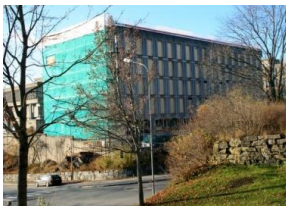
Slik er det i dag

Vi har fått vite fra eieren, Entra Eiendom AS at rehabiliteringsarbeidet, som har pågått en tid, er for å gjøre kontorlokaler tilgjengelig. Én etasje er bortleid til Scandpower, et internasjonalt konsulentfirma, mens Entra, i skrivende øyeblikk, er i forhandlinger med flere interessenter.