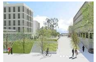
Slik vil det muligens bli.

1. etasje skal gi plass til rettssaler for Asker og Bærum Tingrett. (bilde til høyre er fra Finn.no)