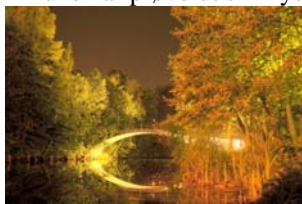
Løkke bro, sep. 08