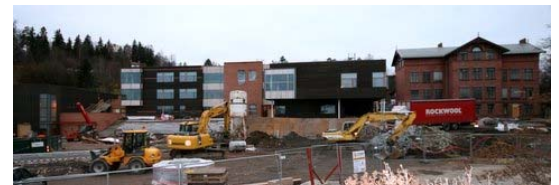
Den nye Evje skole under bygging i november 09

Klasseromsbygget til venstre på bildet til venstre er revet og et nytt, større og moderne klasseromsbygg reiser seg i dets sted. Det gamle ærverdige bygget blir rehabilitert rektor rapporterer at elevene møter til første skoledag 7. april 2010. Vellet har vært involvert ifm trafikken til og fra barnehavene innerst i Stanga. Vi håper at trafikkavviklingen i Stanga kan bli løst i.f.m. en ny reguleringsplan for hele området som Bærum Sykehus har bebudet.