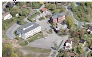
Evje skole før riving

Klasseromsbygget til venstre på bildet til venstre er revet og et nytt, større og moderne klasseromsbygg reiser seg i dets sted. Det gamle ærverdige bygget blir rehabilitert rektor rapporterer at elevene møter til første skoledag 7. april 2010. Vellet har vært involvert ifm trafikken til og fra barnehavene innerst i Stanga. Vi håper at trafikkavviklingen i Stanga kan bli løst i.f.m. en ny reguleringsplan for hele området som Bærum Sykehus har bebudet.