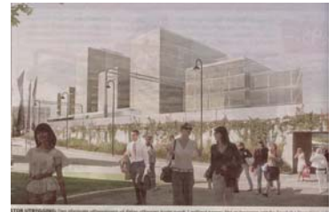
Utbyggers forslag sett fra S Storsenter mot nord

Når dette leses har høringsfristen for ovenstående reguleringsplan gått ut. Kommunen la ut to alternativer, ett utarbeidet av utbyggerne, Sjølyst Utvikling/Enøk Consult, og ett som er utarbeidet av kommunens planavdeling. Begge tar for seg utbyggingsplaner for området fra E S vei nr. 10 ("Humanagården", eller "Kjettingen") t.o.m. nr. 26 (den tidligere Låsua). Kommunens alternativ holder seg til de forutsetninger som er nedlagt i vedtatt kommunedelplanen for Sandvika, mens utbyggerens forslag går utover disse, spesielt når det gjelder bygghøyder. Reguleringsplanalternativene finnes på kommunens hjemmeside, mens Sandvika Vels kommentarer, som i det store og hele støtter kommunens forslag, finner du på vellets hjemmeside.