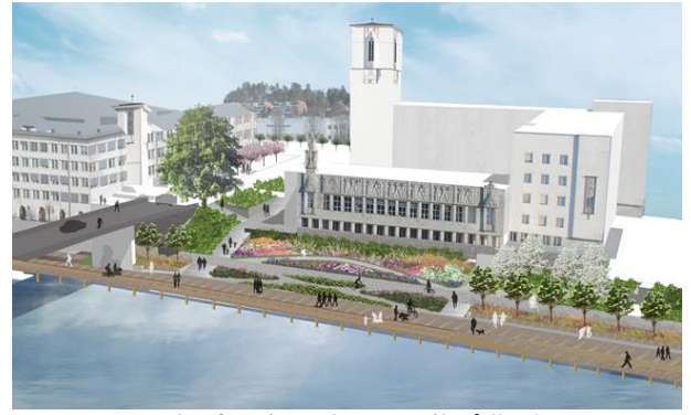
Promenaden fra Rigmorbryggen til Rådhusbroen

Bildene over er hentet fra et av kommunens skisseprosjekt