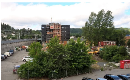
Slik ser det ut i dag ---