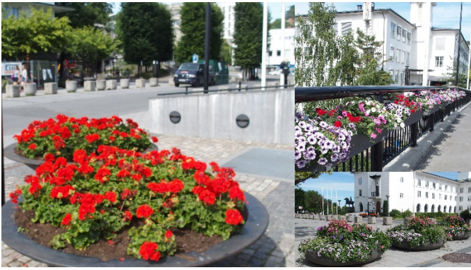
Blomster ved Rådhus og Rådhusbroen