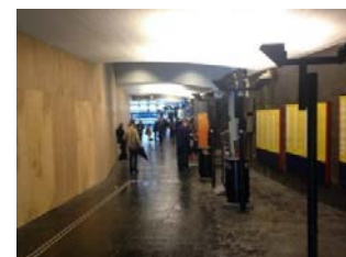
Bilde fra Budstikkas hjemmeside

http://www.budstikka.no/sandvika/samferdsel/tog/sandvika-stasjon-forst-ferdig-neste-ar/s/5-55-325534