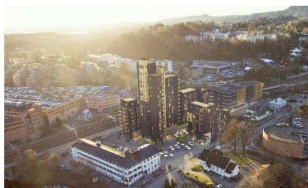
--- og slik har arkitekten tenkt det skal se ut ved ferdigstillelse

I Ditt Vel 2-16 annonserte vi at det i nærmeste fremtid vil bli presentert en ny reguleringsplanen til 1. gangs høring. Den foreligger og ble i juni i år sent på høring. Sandvika Vel arbeider i skrivende øyeblikk med en høringsuttalelse. Kommunens høringsdokument finner du på vellets hjemmeside og vi inviterer våre lesere til å komme med komment-