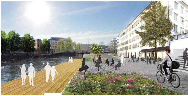
Promenaden sett fra Rådhuset mot Kinoveibroen