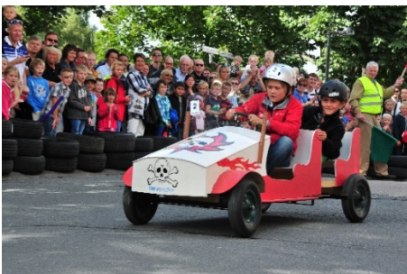
Olabiløpet i 2012

En overraskende varm vår kom og gikk, og når dette leses er vi i ferd med å legge en behagelig sommer bak oss. Men før sommeren er over skal de fleste av oss delta i den stadig mer omfattende Sandvika Byfest!