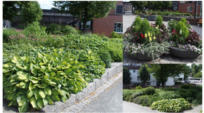
Den vakre og frodige Rønne Park