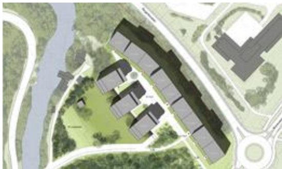
Ill. Dyvik arkitekter

Skissen over viser OBOS forslag om å bygge 173 leiligheter i fire blokker med ryggen mot E 16 og tre mindre bygninger.