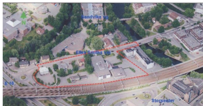
Planområdet med rød stiplet linje

Planutvalget behandlet for 2. gang detaljregulering medio april i år og sendte saken til formannskapet og kommunestyret. Forslaget legger til rette for utvikling av allsidig bybebyggelse som kontorer, forretninger, offentlig og privat tjenesteyting.