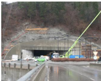
Nisser og dverge bygger i berge

Fra Statens Veivesen er vi informert om at følgende arbeider vil pågå frem til våren/sommeren i år: