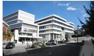
Slik ser det muligens ut i fremtiden

Vi har "stjålet" ovenstående bilde fra utførende arkitekts hjemmeside. Med vårt generelle kjennskap til arkitekter i alminnelighet, kan vi anta at det endelige resultat nok blir annerledes. Vi noterer bl.a. at "spansketrappen" opp til Øvre Torg er inntakt, mens vi har latt oss fortelle at trappen skal rives og at det vil skje i løpet av innværende sommer! For nærmere detaljer anbefaler vi et besøk på følgende lenke: