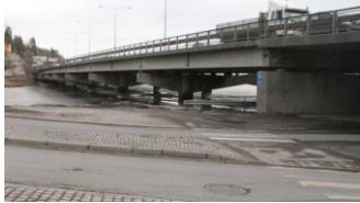
Denne monsterbroen må bort!

Som vi rapporterte i årsmeldingen har vellet vært involvert i samarbeid med Statens Vegvesen om planleggingsdetaljer, og styret har slått seg til ro med en løsning med E-18 i tunnel under Sandvika fra Solviksområdet til Gyssestad/ Slepanden. Dermed har vi fått vårt ønske om å bli kvitt "Monsterbroen" innfridd. Vi har tidligere klynget oss til håpet om at Oslopakke 3 og bompenger skal stå for finansieringen. I skrivende øyeblikk er det stor forvirring når det gjelder finansieringen, og det er ting som tyder på at vi kan gå mot en såkalt OPS finansiering, d.v.s. et spleiselag mellom stat og næringsliv (og ytterligere bompengefinansiering?). Den som lever får se, heter det. Det er ting som tyder på at en skal måtte leve lenge for å ha gleden av å oppleve en endelig løsning!