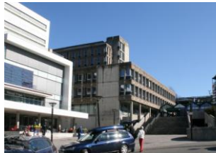
Slik ser det ut i dag

Trygdegården i Malmskriverveien skal bygges om og gi plass til et nytt kunnskapssenter som forventes å stå klart årsskiftet 2013/14. Det skal inneholde deler av utdanningsvirksomheten til Høyskolen i Oslo og Akershus og deler av Bærum kommunes kurs- og voksenopplæringsvirksomhet. Anlegget vil også tilby møte- og konferansefasiliteter for eksterne brukere samt kontorlokaler.