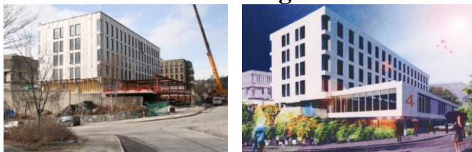
Det gamle politihuset under ombygging og som Entra og Dyrvik Arkitekter AS mener det skal bli

Malmsskriverveien 4, som er under ombygging, vil i 1. etasje gi tilleggsarealer til A & B Tingrett, midlertidig Kunnskapsenter for Bærum Kommune/høgskolen i Oslo og Akershus. Øvrige etasjer vil være til normal kontorleie. Planlagt ferdigstillelse er september 2011.