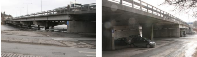
Denne monsterbroen må bort! Sandvika vil ha kontakt med sjøen!

E-18 har i mange år vært en gjenganger i media og ikke minst i Budstikka. Statens Veivesens forslag til løsninger har vært publisert og vellet har levert sin høringsuttalelse. Den er å finne på vellets hjemmeside. Kortversjonen er at den monsterbroen som er vist på bildene vil vi ha bort – Sandvika vil ha tilbake sin kontakt med sjøen. Vi vil, som våre politikere, ha en ny E-18 i tunnel under Sandvika!