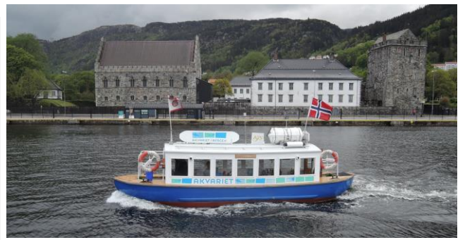
Bergen Elektriske Ferge «Beffen» er et markant innslag på Vågen i Bergen.