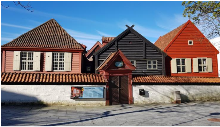
Schøtstuene var hanseatenes forsamlingsrom, og det var her de møttes for å dele mat og drikke.