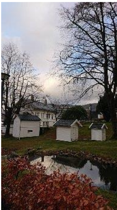
Laksevåg kulturhistoriske museum frembyr kulturminner fra gamle Laksevåg og krigsminner fra 2. verdenskrig.