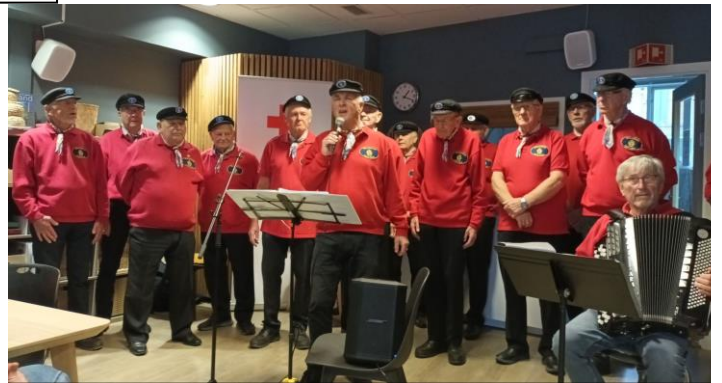
Shantykoret Cape Horn