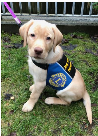
Soneprosjekt 104C, Sone 3: LIONS Førerhundskole og Blindesaken