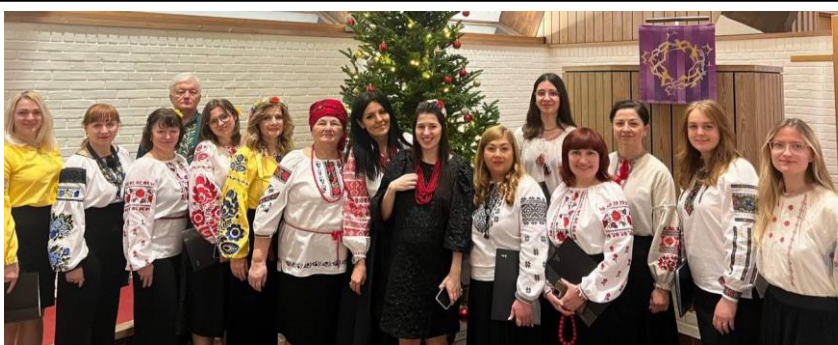
Ukrainsk folkesangkor «Kvitka Dushi»