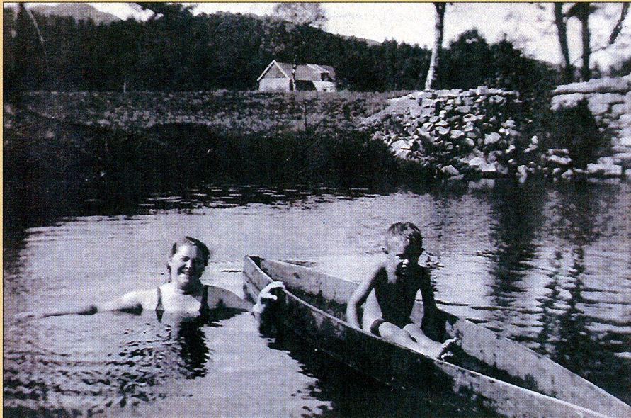
Badeliv anno 1943 Rosenkilde i bakgrunnen