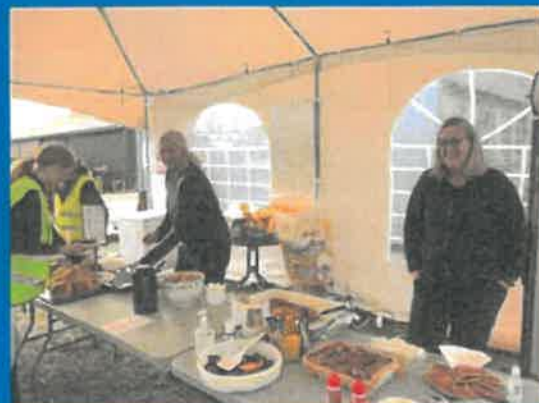
ÅPEN DAG 2021 TORVASTAD RIDESENTER OG NORD-KARMØY RIDEKLUBB