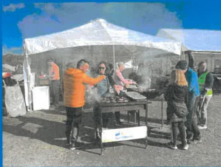
ÅPEN DAG 2021 TORVASTAD RIDESENTER OG NORD-KARMØY RIDEKLUBB