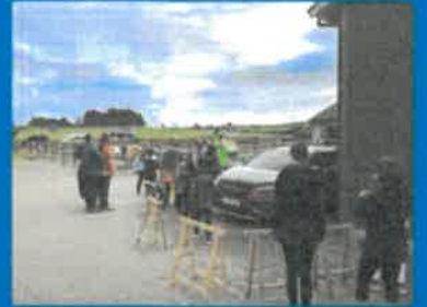
ÅPEN DAG 2021 TORVASTAD RIDESENTER OG NORD-KARMØY RIDEKLUBB