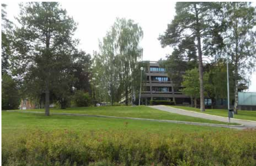
Rådhusparken 2.september 2023. Bildene på denne siden er tatt samme sted