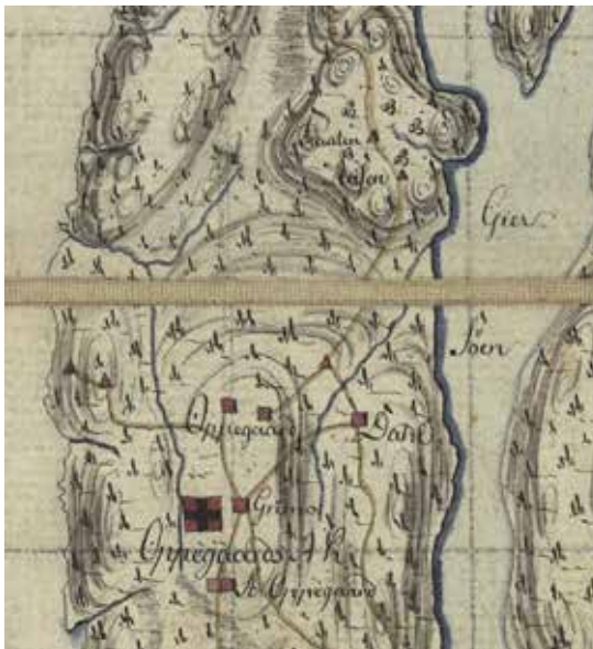
Kart fra 1830 som viser veier på Svartskog

Vi begynner med stedsnavnet Sandvad som viser til vadestedet i Gjersjøen mellom plassen Skjærvika like nord for Tyrigrava og svingen like sør for avkjøringa til Svartskog. Et vadested er et grunt område hvor en sti eller vei krysser en bekk eller elv, og hvor det ikke er en bro eller klopp. Noe å tenke på er at Gamle Mossevei ble anlagt rundt 1860 som hovedvei fra Christiania og sørover ut av byen. Denne veien ble som den første i landet bygget etter det nye “chausseprinsippet” hvor veien ble jevnet mest mulig ut og dumper og søkk ble gjenfylt, slik at det ble minst mulig stigning, og veien skulle føye seg inn i terrenget. Det var ingen kjørbær vei ned fra Svartskog annet enn en sti for tømmertransport ned til Gjersjøen. På gamle kart ser vi at veiene på Svartskog gikk fra Ljansbruket (Gjersjelvdalen) i nord via Hvitebjørn og Bjørnsrud sørover til dagens stoppested Sandvadtøppen og videre vestover forbi plassene Bråte, Åsen, Lerskallen mot Oppegård kirke. Videre sørover gikk veien til Sjødal og til slutt Kjærnes og Nordby i Ås. De som