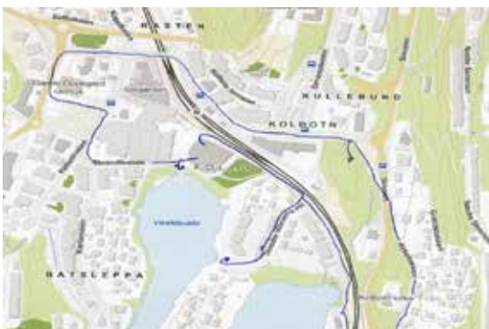
Ruten for rusleturen i Kolbotn sentrum 21.10 markert med strek på kartet.