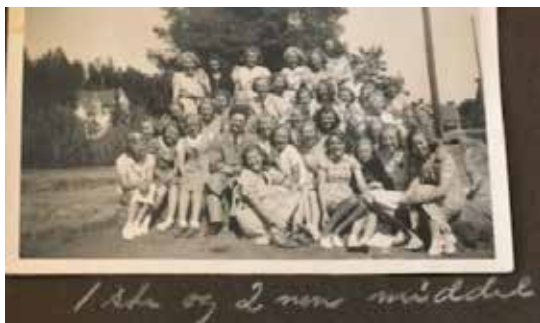
Første- og andreklasse ved Kolbotn middelskole 1940