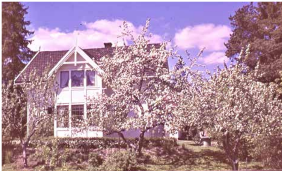
Epleblomstring på Kolbotn på 1960-tallet

førte rett inn i hagen vår og epler fristet. Elever fra hele kommunen kom den veien til og fra skolen. Alle som spurte fikk epler, og noen løp på raske føtter inn og ut. Faren vår synes det var greit da vi hadde masse, bare de ikke brakk greiner. Vi som bodde der var også på epleslang. Det var for sporten skyld og spennende i mørke høstkvelder.