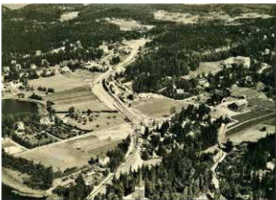
Kolbotn på 1930-tallet