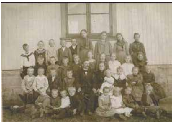
Elever og lærere ved Bålerud skole fra tida fanen var ny.

På 1880-tallet ble Bålerud og Kullebunden skoler innmeldt i skytterlaget i Akershus og det ble drevet iherdig skytetrening etter skoletid og arrangert skytekonkurranser mellom skolene med lærene ved skolene i spissen.