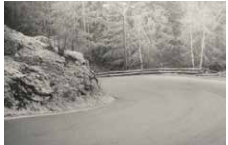
Kollen som ble fjernet i 1983

Utover 1930-tallet begynte rutebilene trafikk utover til Ljansbruket og Svartskog for fullt, de gikk for det meste langs den nyopprettede Ingierstrandveien og videre til Oslo. Både Ingierstrandveien og Ingierstrand bad ble anlagt på begynnelsen av 1930-tallet. Denne busstrafikken utkonkurrerte Nesoddbåten som fram til krigen hadde anløp fra Svartskog brygge og Bålerud brygge på sin vei til og fra Oslo, sommerstid var det også båt til og fra Ingierstrand bad. Da Bålerud skole (nåværende Solheim grendehus i Bekkenstenveien) ble nedlagt på begynnelsen av 1950-tallet ble svartskogbarna kjørt i buss til Kolbotn skole. I Sandvadbakken måtte veien utbedres såpass at det gikk an å ta seg fram med alle slags kjøretøy. I flere omganger i tidsrommet 1925-1940 ble stigningsforholdet i bakken utbedret ved å gjøre svingene noe rommeligere. Så seint som i 1983 ble en kulle midt i "indre sving" sprengt bort slik at man som sjåfør i det minste fikk en viss oversikt over trafikken i bakken.