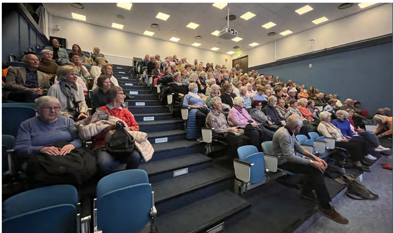
FULLT AUDITORIUM på temadagen.