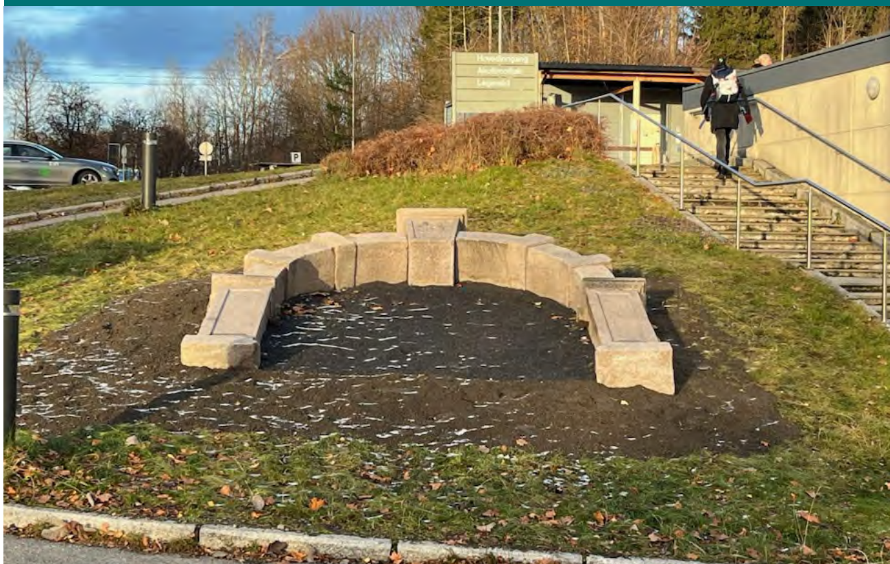
PORTEN slik den ligger i dag.

Venner av Bærum sykehus gratulerer sykehuset med de første 100 årene. Venneforeningen har bevilget kr. 100 000 til restaurering og tilbakeføring av den originale sykehusporten. Venneforeningen ser en viktig symbolikk i at porten kan minne oss på historien og gi inspirasjon for alle inn i fremtiden. Porten er ikke dimensjonert til dagens krav, men den har fått en viktig symbolplass mellom akuttmottakets inngang og sykehusets hovedinngang.