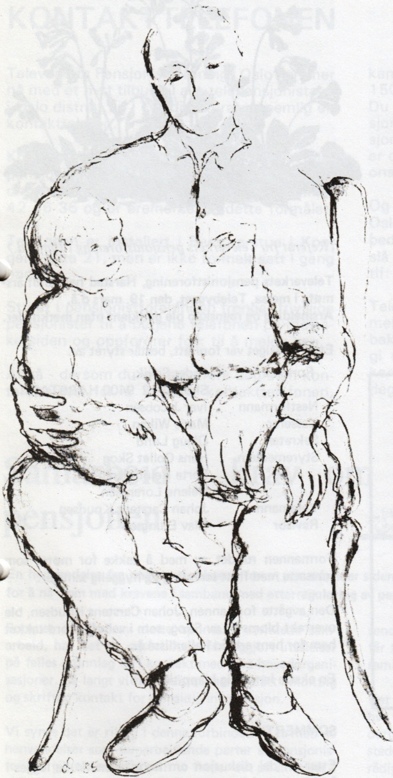
Ill.: Oddrun Sæter