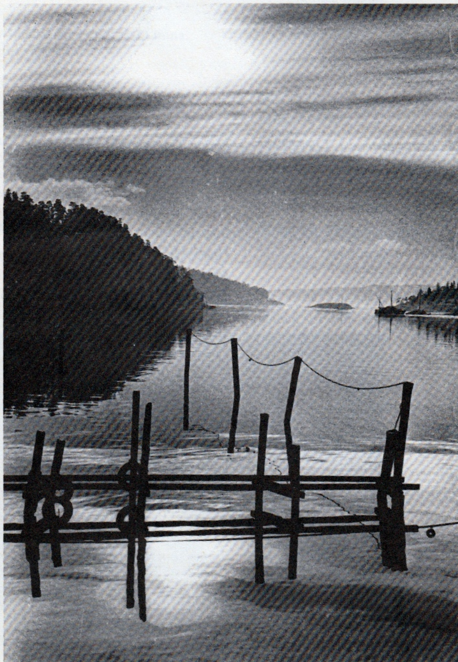
VÅR I FROGNERKILEN