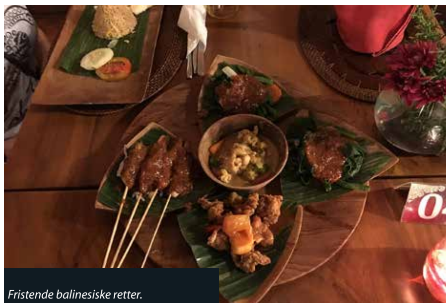
Fristende balinesiske retter.