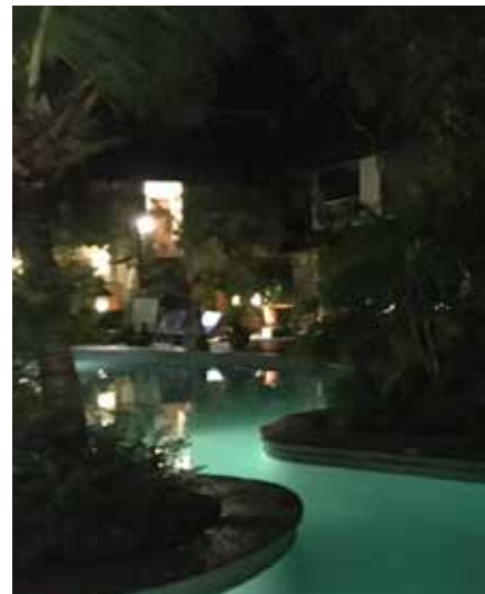
Hotellet i Sanur.