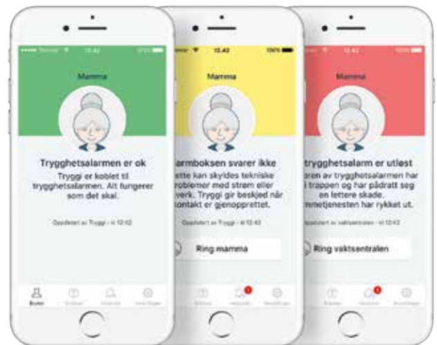
Tryggi er enkel og brukervennlig

Pårørende kan til enhver tid sjekke om trygghetsalarmen er tilkoblet, og grønn farge indikerer at alt fungerer som det skal.