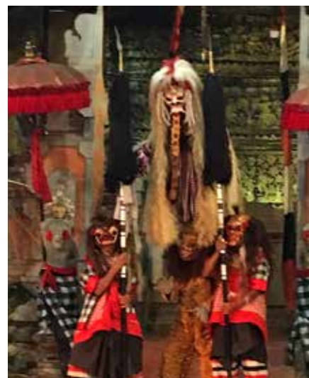
Dans som viser den indonesiske kulturen, og kampen mellom det gode og det onde.