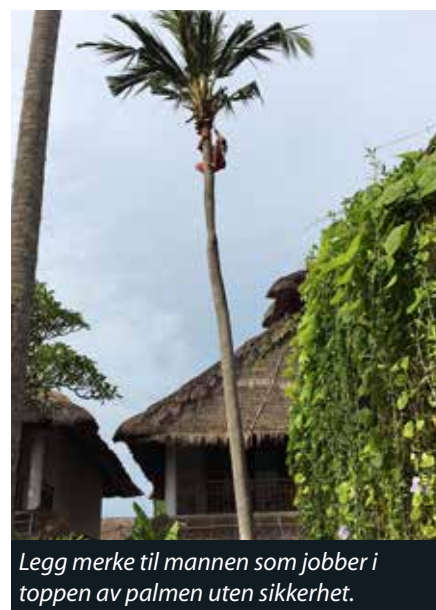
Legg merke til mannen som jobber i toppen av palmen uten sikkerhet.