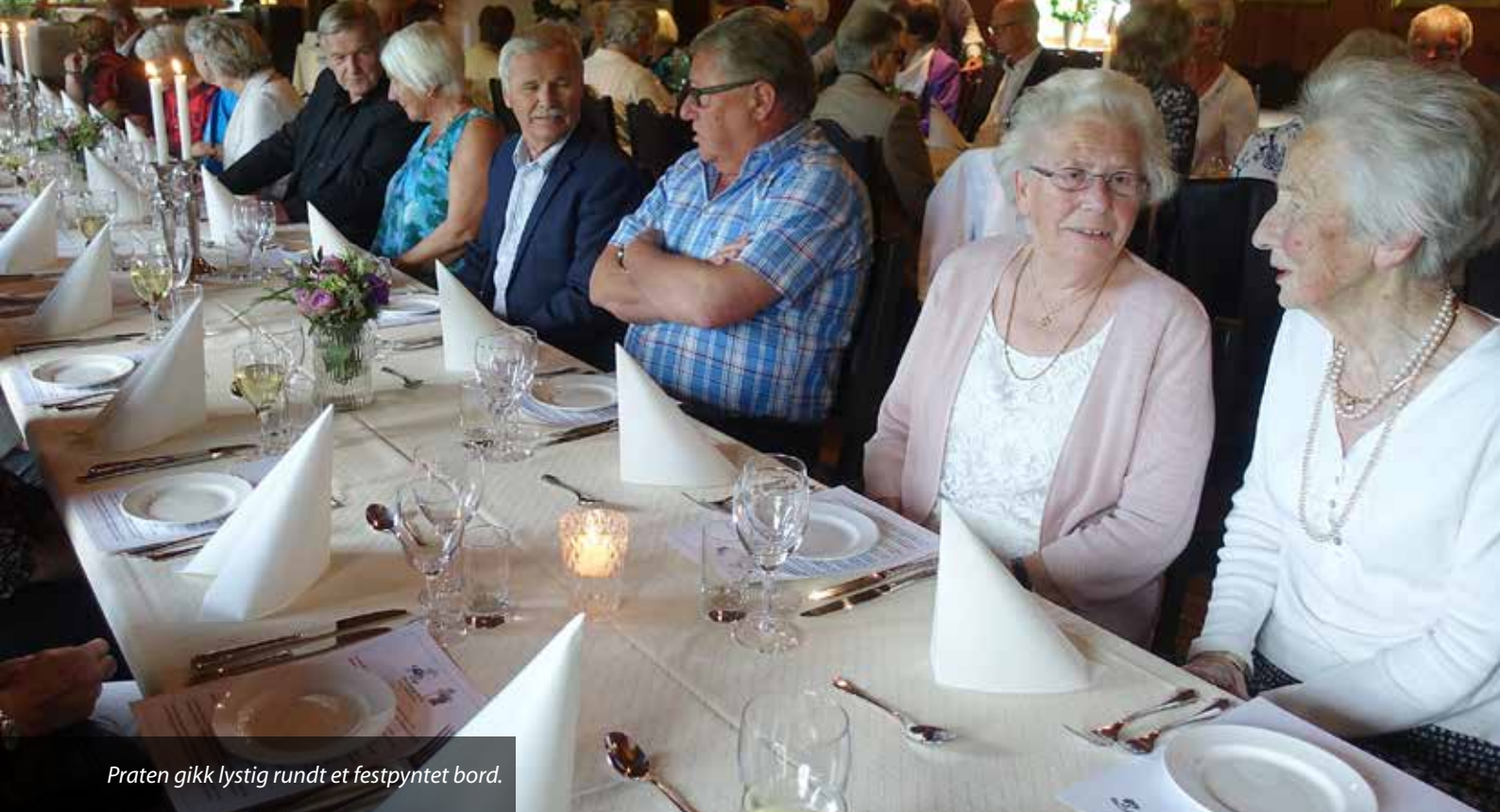
Praten gikk lystig rundt et festpyntet bord.