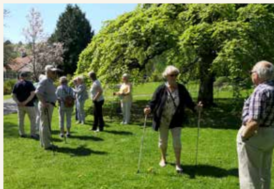
Her passerer vi hengealmen, ett av over tusen ulike trær og busker på området.

Parken består ellers av tusenårshagen og et staudeområde. Det planlegges i tillegg et felt med spiselige planter.