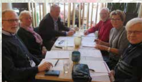
Aktive grupper på lederkonferansen