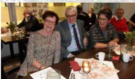
Hamar feirer førti