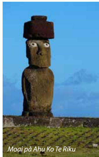
Moai på Ahu Ko Te Riku

Finn ut når radioskiftet skjer der du bor på www.medietilsynet.no/digital-radio . Der kan du blant annet få informasjon om dekning, mottak, DAB+ i bil og gjenvinning. Du kan også sende epost med spørsmål til digitalradio@medietilsynet.no .