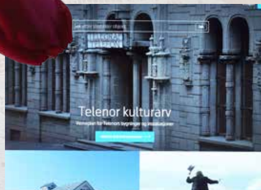
Telenors historie på nytt nettsted