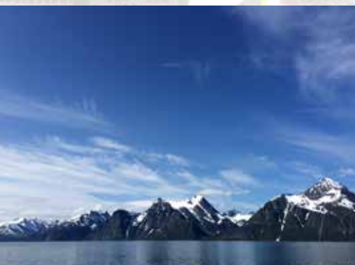
Fra telefonens barndom i Lyngen