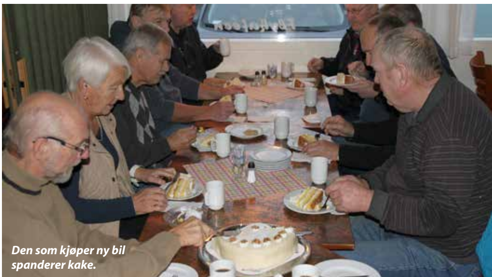
Den som kjøper ny bil spanderer kake.