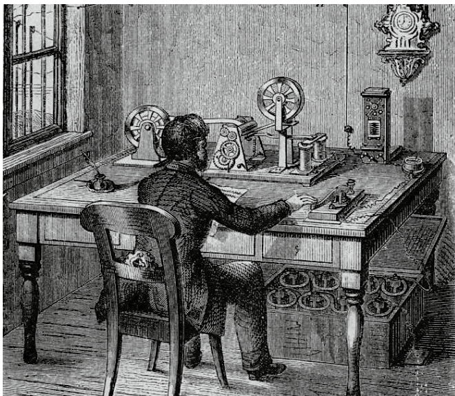
Telegrammets afsendelse. Etter teikning i Oppfinningarnas bok (1874).

Telepensjonisten ønsker alle lesere en fin adventstid og en god og fredelig jul!