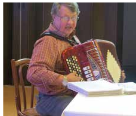
Erling Hovland skapa stemning med song og trekkspel.