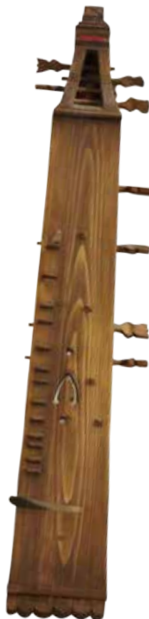
Denne langeleiken er en nøyaktig kopi av en langeleik fra 1524. Kjell lagde den av en granstokk. Originalen er den eldste som er funnet i Europa.