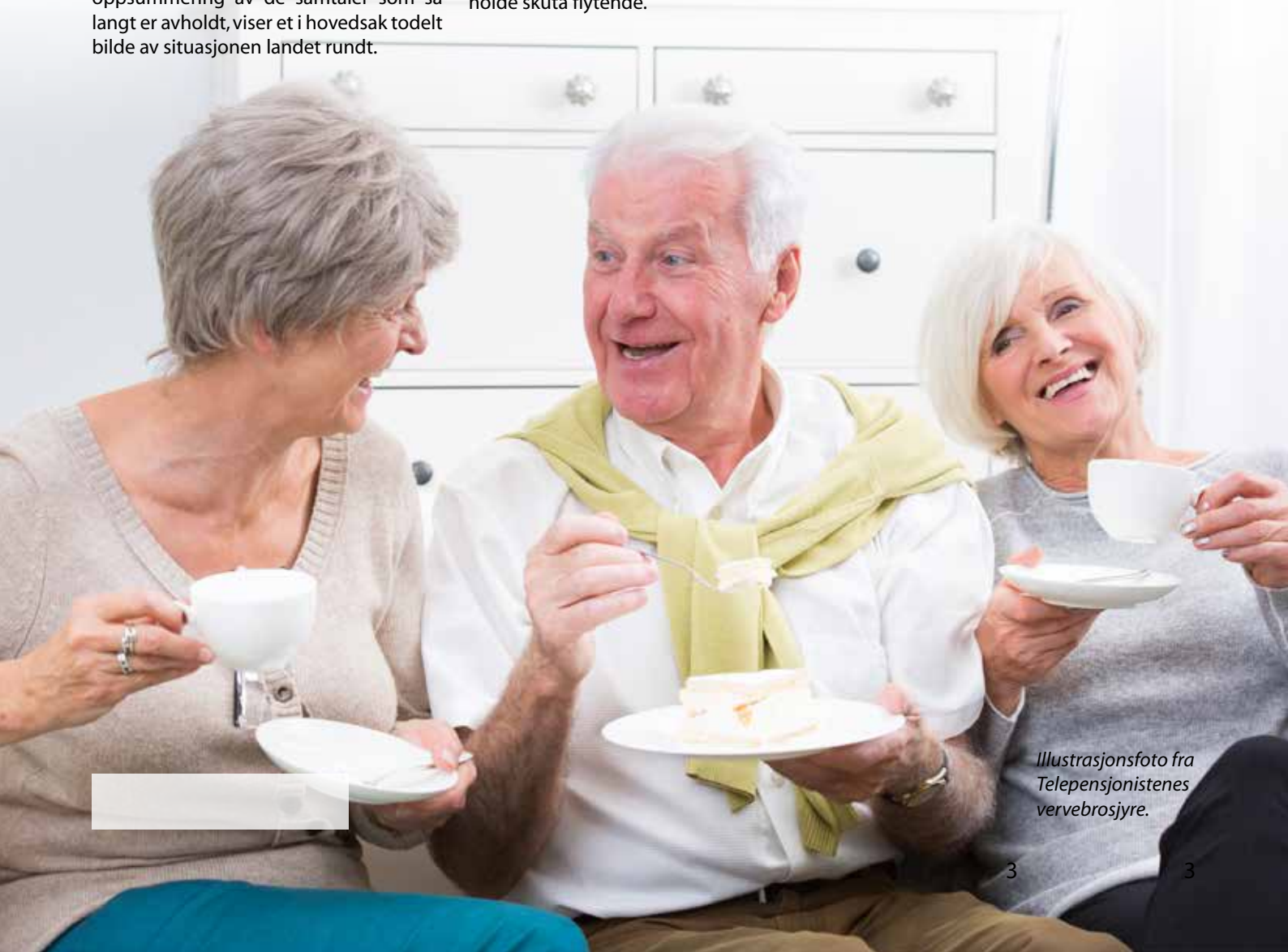
Illustrasjonsfoto fra Telepensjonistenes vervebrosjyre.

Og det er imponerende og morsomt å høre om de mange kreative ildsjeler som utrettelig jobber for det felles beste, og for at telenorpensjonister fortsatt kan møtes og ha det bra sammen.