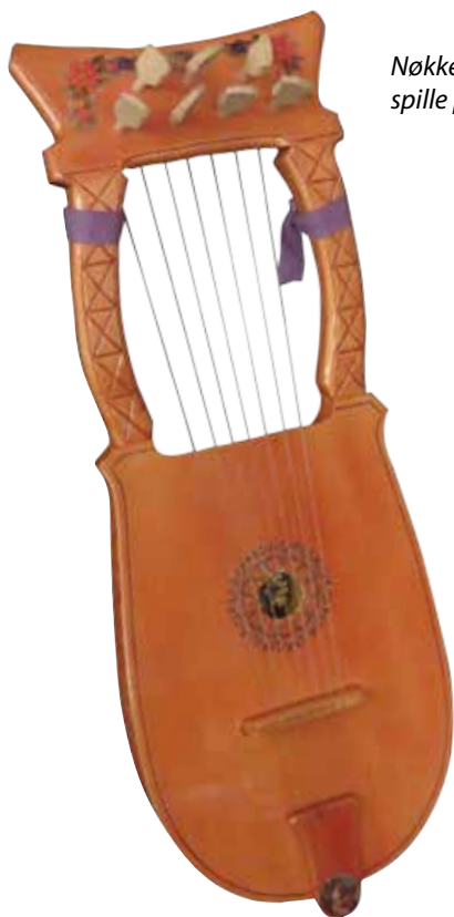
Nøkken er kjent for å spille på lyre.

Konklusjonen er klar, tradisjonen går ut hvis den ikke blir tatt vare på. Det trengs en ny ildsjel.