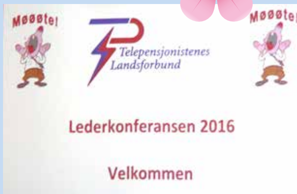
Vellykket lederkonferanse på Lillestrøm