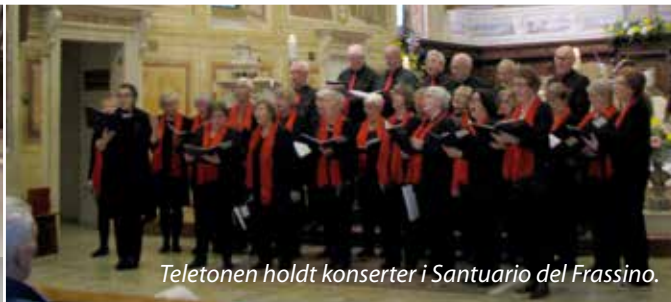
Teletonen holdt konserter i Santuario del Frassino.