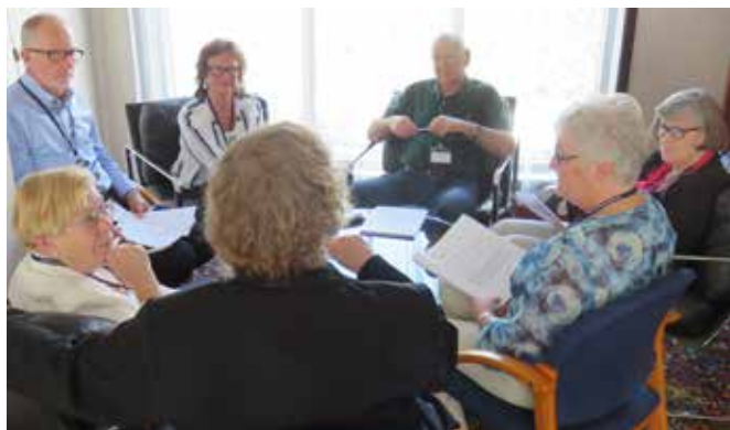
Friske diskusjoner i gruppene.

- Dette har vært en god opplevelse. Alle har uttalt seg, og det har vært mer informasjonsutveksling og mindre prinsippdiskusjon enn tidligere, konkluderte han. - Takk for innsatsen!