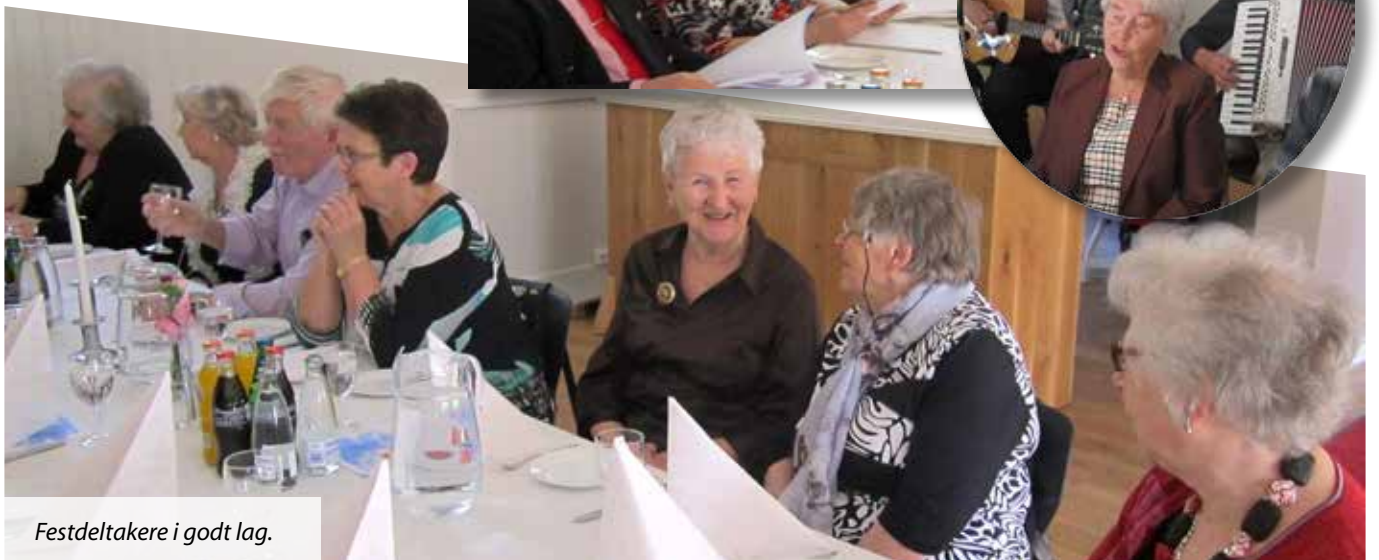
Festdeltakere i godt lag.