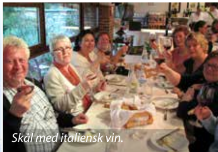
Skål med italiensk vin.

Hjemreisen gikk med fly fra Milano til København hvor vi skiftet fly til Flesland. Samtlige 39 deltakere var enige om at vi hadde hatt en fantastisk tur med sommervær og fine opplevelser.