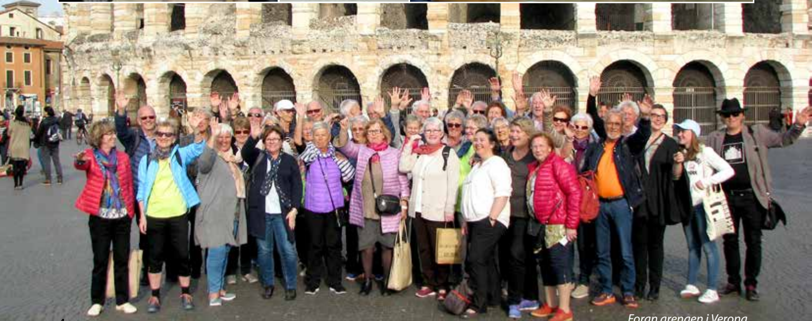
Foran arenaen i Verona.