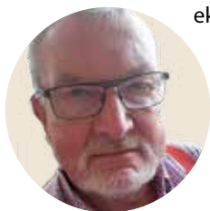
Langeeggen er fornøyd med sin nye "Frihet".

Hos Telia heter dette abonnementet «Roam like Home» og hos Telenor «Frihet» og «Ung». Telia tilbyr dette som et nytt abonnement i tillegg til de eksisterende.