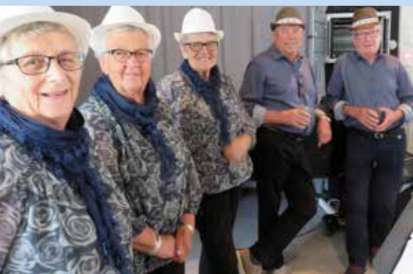
Ønskehattene med glad sang på Gjøvik