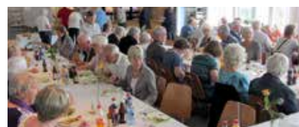
God stemning rundt lunsjbordet

Etter en god lunsj med etterfølgende kaffe og kaker var det underholdning ved en gruppe som kaller seg Ønskehattene. Dette er en gruppe svært engasjerte frivillige personer som, med utgangspunkt i Vestre Toten, sprer sang og glede rundt om i lokalsamfunnet. Gruppen består av ni medlemmer, som en glad gjeng på fire damer og fem menn, alle med flotte