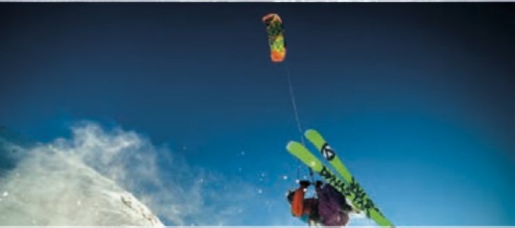
NORGES BESTE OMRÅDER FOR KITING