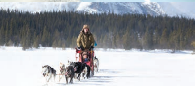
KJØR DITT EGET HUNDESPANN