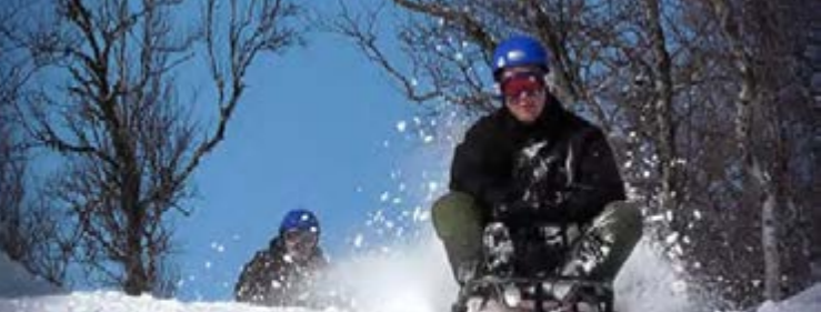
EN AV NORGES LENGSTE ÅKEBAKKER