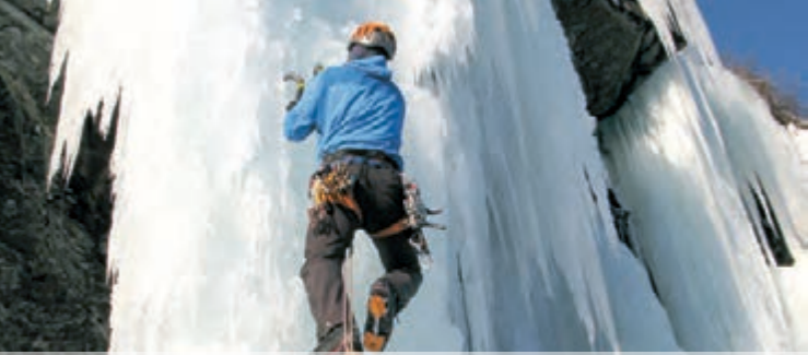
KLATRING I FROSNE FOSSEFALL