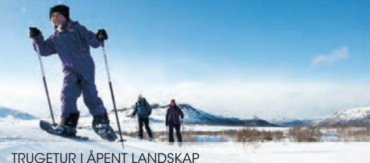
TRUGETUR I ÅPENT LANDSKAP