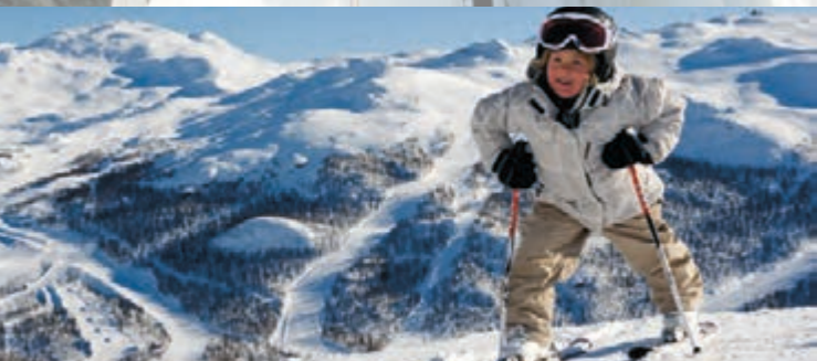
10 SKIHEISER 150 NEDFARTER