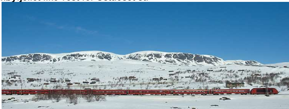
Bildet: El 18 og B7 vogner med Øynaden og Hallingskarvet i bakgrunnen

Det er med glede vi kan ønske deg velkommen til dette flotte feriestedet vakkert beliggende på høyfjellet like vest for Ustaoset st.