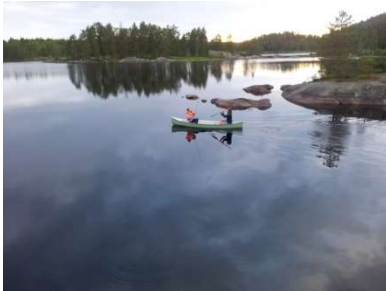
Kanopadling på Høl er rekreasjon