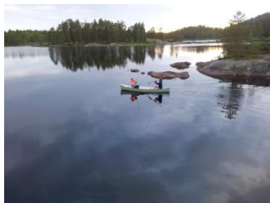
Kanopadling på Høl er rekreasjon