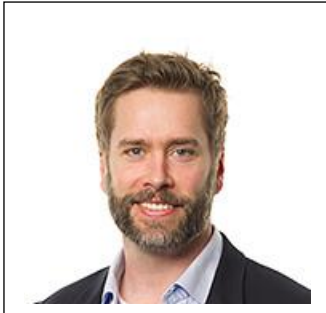
Martin Foss Foto: