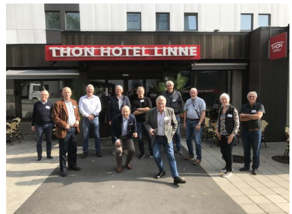
Lederkonferansen ble gjennomført innen gjeldende smittevernkrav. Thon Hotell Linne september 2020.