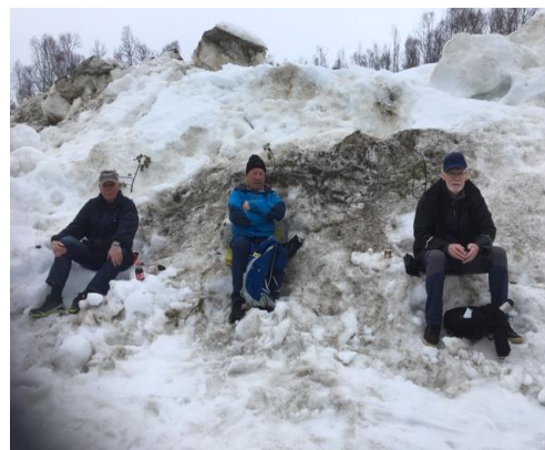
Koronatilpasset samling i avdeling Indre Troms for snart et år siden .....

FSF ønsker dere alt det beste for 2021, og håper vaksineringen vil ta kontroll på smittesituasjonen slik at vi kan få normal aktivitet i avdelingene igjen.