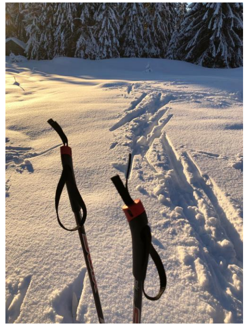
Håper på mye godt skiføre fremover